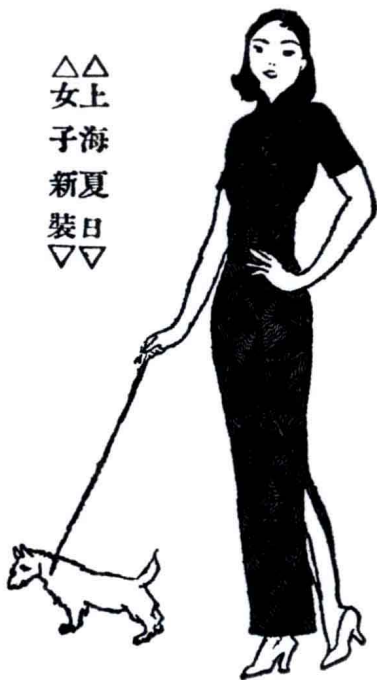
图0-1 不少学者以为“旗袍”一词应专指民国及以后流行的袍服。图为民国报刊《北洋画报》（1932年第820期）上刊登的“上海夏日女子新装”——妙龄女郎身穿一袭满身花纹的紧身長款旗袍，此时的旗袍与清代旗人的袍服确实有很大的差异。

其在所著《中国旗袍》以及《近代中国女装实录》中将“旗袍”和“旗女之袍”分别进行了定义。清代女性旗人所穿之袍称作“旗女之袍”——“清代女性旗人所穿之袍，发展上可分为两个阶段，前期较为瘦长紧窄，袖口亦小，装饰简单，适应其重骑射的生活方式。后期由于生活安定，旗女之袍变得宽肥，装饰繁复”。而“旗袍”仅用于指称民国时期的实物，定义“旗袍”为“具有中国民族特色的一件套女服，由清代旗人之袍装演变而成，但