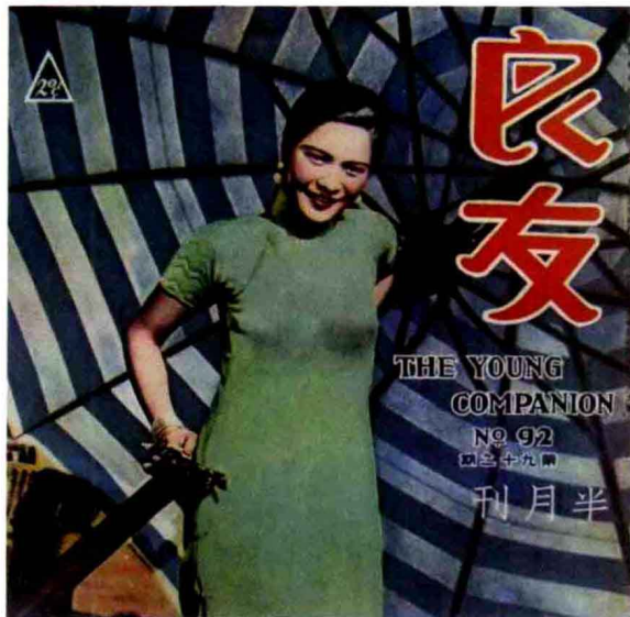
图0-3 1934年第92期《良友》封面，旗袍款式更加突出身体曲线，肩部和腋下更加服帖。