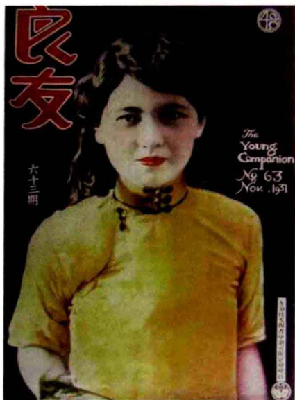
图0-2 1931年第63期《良友》封面。20世纪30年代初期，明显可见此款旗袍剪裁技术仍然比较传统。由于前片没有胸省，侧面腰省亦不明显，因此整体造型比较平直。

的下端及左右腋下盘有如意形镶滚。清末时期，西方生活方式渐渐渗入，服饰也有尚西从简之间势。北京作为清王朝都城，相对于直接受西方风尚影响的东南沿海开埠城市，变化相对小一些，但仍然存在。尤其服饰的规定制度相对没有以前严格，如礼服简化，袖口去掉马蹄式等。另一方面，清末奢侈之风大起，旗装袍之边饰尤其繁复多样，并形成一种时尚。