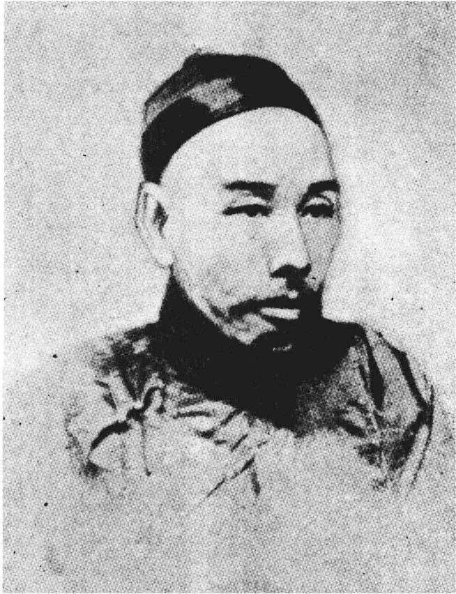
黄 遵 憲 像