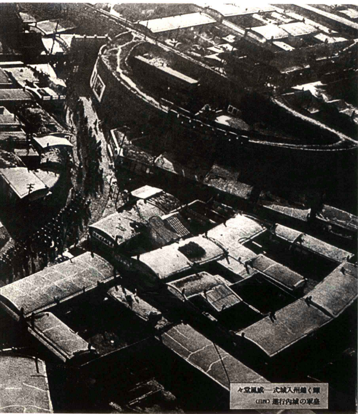
々堂風威一式城入州鐘く輝 (H1M) 進行内城の軍臺