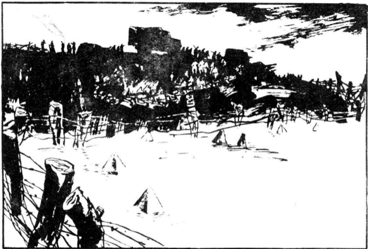
9 为了防备盟军入侵，德军在一切可强行登陆的地点，修筑了坚固的防御工事。