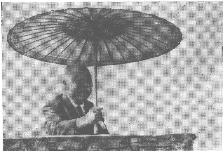
行政院副院長內任，參觀三軍演習