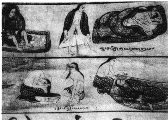
《藏民生活百态图》(局部,18世纪):所谓生活百态,归纳起来只有两态——食和性。

异性感兴趣,要性交,通过性交来繁衍后代。这是两大基本生活需要,也叫本能,就是说,它是与生俱来、不用教的。然而,人