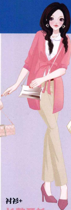
衬衫+ 长款开衫+ 修身长裤

针织开衫和衬衫的搭配是提升亲切感的最佳搭配。小开衫、及膝裙的搭配让你看起来更加温柔可人。