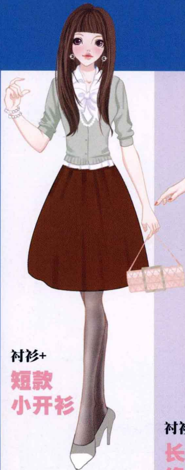
衬衫+ 短款 小开衫

针织开衫和衬衫的搭配是提升亲切感的最佳搭配。小开衫、及膝裙的搭配让你看起来更加温柔可人。