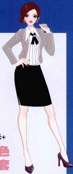
衬衫+ 灰色 外套