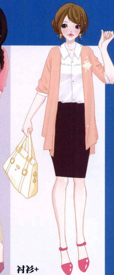
衬衫+ 长款开衫+ 窄裙

衬衫搭配上一件宽松的长款开衫，更能增添一份随意感，下身修身的长裤会让你看上去不会太懒散。