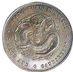
▲ 光绪十七年（1891）·广东省造光绪元宝库平三钱六分银币1枚

鉴赏要点：精铸近于镜面。广东是中国近代率先设立银元局开铸银元流通于世的省份，此版银币于1891年铸造，之后成为各省仿铸之标准版式，流通甚广，此枚银币属横初铸品，极少见，完全未使用品。