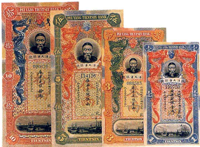
▼ 清·李鸿章像北洋天津银号库平足银纸币

鉴赏要点：精铸近于镜面。广东是中国近代率先设立银元局开铸银元流通于世的省份，此版银币于1891年铸造，之后成为各省仿铸之标准版式，流通甚广，此枚银币属横初铸品，极少见，完全未使用品。