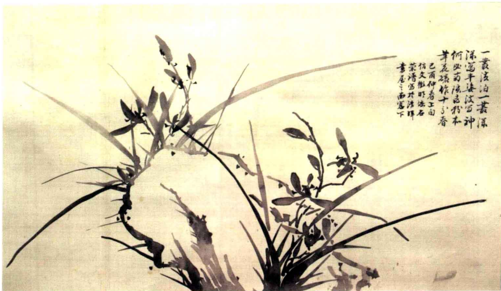
启功高祖载崇的画

母亲”，也可谓极尽讨好之能事了。溥、毓、恒、启四个字是后续上去的，没有什么讲头。