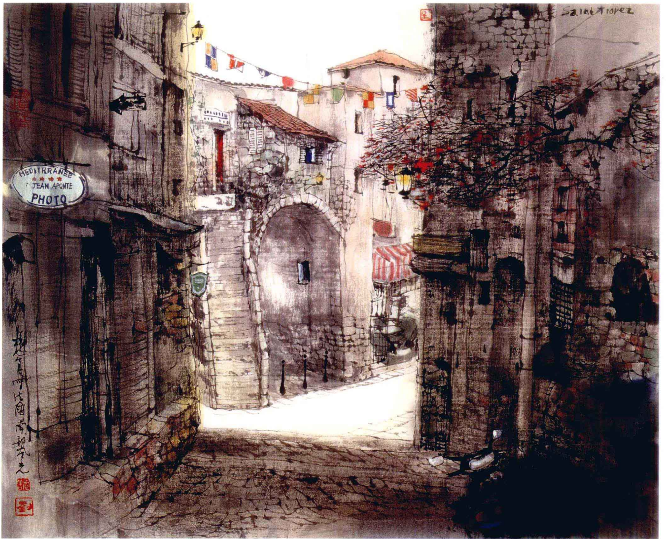
法国南部小镇风光

法国南部海岸的东边部分俗称“蔚蓝海岸”。每到夏天，这里的许多小镇便成了法国人热衷的度假胜地。每年的夏天全法国及全世界的游人都涌来这里。每到傍晚，海边的大道上人们便如潮水一样涌来涌去，而这时镇内的小街上却开始安静起来，只有吉他的弹奏声偶尔带来一种特有的情调。小镇的后面是山，前面是海，海边停靠着世界各地驶来的各色游艇，海员们在海边的小店里一边喝着咖啡和酒，一边遥望着蔚蓝的天空。