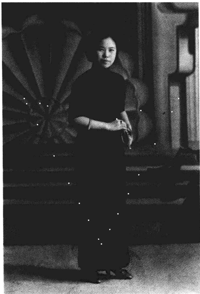
杨虎城将军夫人谢葆真烈士(1911—1947)