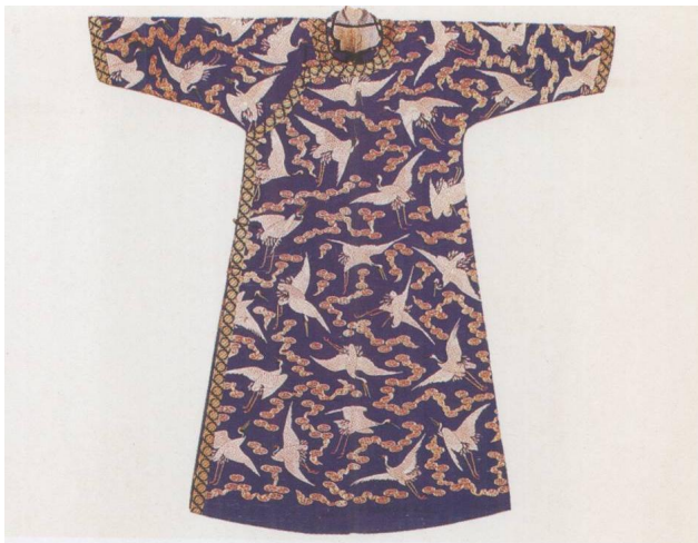
兰色缎绣云鹤便袍