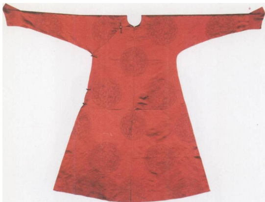
红色团龙暗花缎常服袍