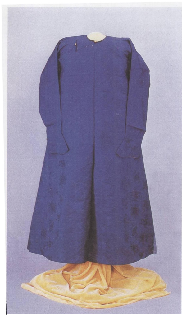
蓝色江山万代暗花缎长服袍