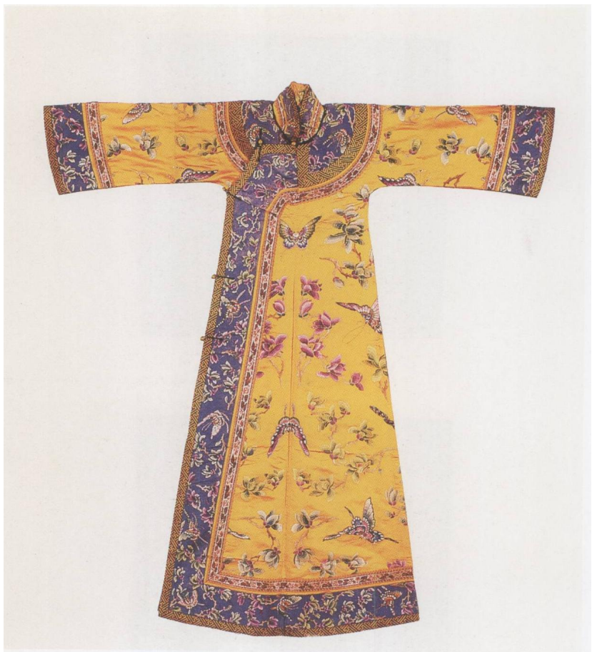
黄色缎绣花蝶便袍