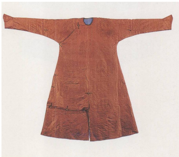
棕色暗花绸行服袍