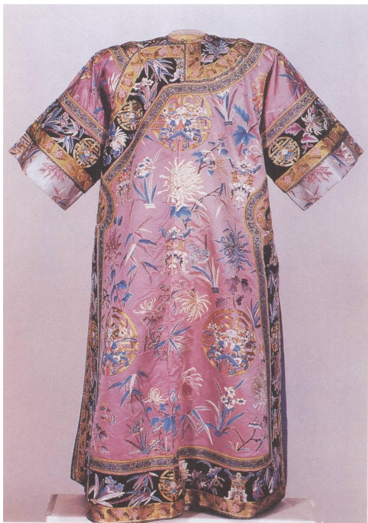
雪青緞绣灵仙祝寿擎衣