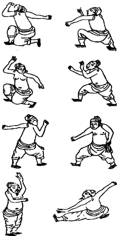
宋太祖长拳(清道光《武备制》)

文化成绩差，但是却很有体育天分，十八般武艺一学就会，现在山东、河南一些地方还流行着一套“太祖长拳”，据说就是他当年发明的。他最拿手的兵器是铁棍，宋代人就有“太祖一根哨棒打下四百州江山”的说法，赵匡胤之后的北宋皇帝外出巡行，会专门有人扛着一根铁棍跟在后面，据说那就是赵匡胤当年的兵器，上面还有他的指纹。更有意思的是，据说双节棍也是他老人家发明的，只不过当时的双节棍一长一短，叫做“盘龙棍”，用来装备部队，主要是为了攻击敌人骑兵的马腿，后来才发展成现在这种双节棍的样子。