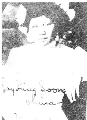
在美学习的宋美龄