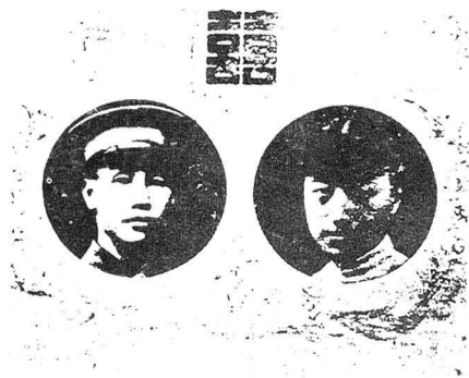
一九二一年蒋陈结婚喜柬