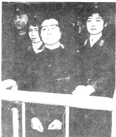
1981年，特别法庭判江青死刑， 缓期二年执行。