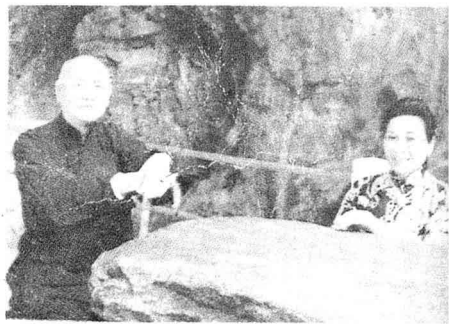
晚年的蒋介石夫妇