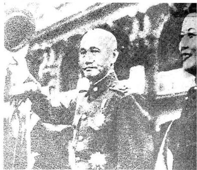
名人夫妇“一九五〇”年 蒋介石复任“总统”