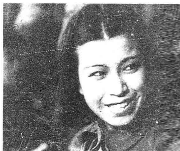
蓝苹演《自由神》剧照(1935年)