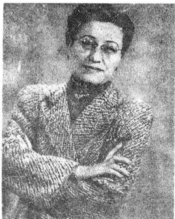
1962年陈洁如初抵香港摄影