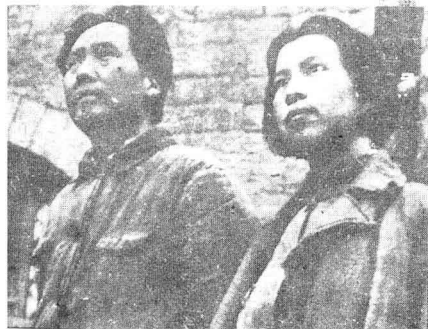
1938年，江青同丈夫毛泽东在延安