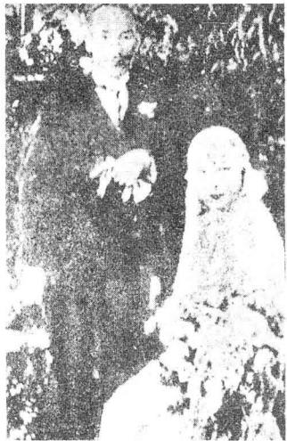
蒋介石与宋美龄结婚留影。