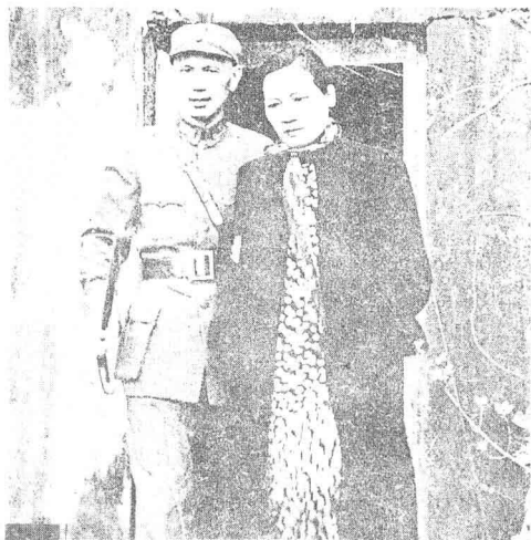
在重庆走出防空洞