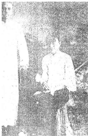
婚后一九二三年春摄于上海