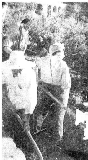
1975年江青在大寨参加