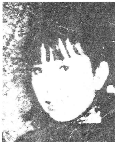
19岁时的李云鹤(江青)