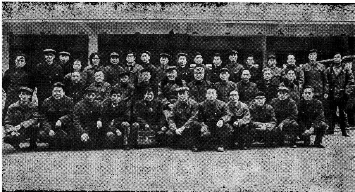
调查队全体队员合影