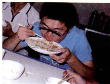
↑ 骑行的最大转变：变成吃货

事实证明饿死鬼不止我一个。下午两点，我们在山坡上的新沟开饭，餐桌上大家风卷残云，菜上来一个光一个，最后菜没了，有人用盘子里的菜汤拌米饭吃，嘴里不停嘟囔着“香”，这样的状况一直持续到拉萨。“我很能吃苦”，这五个字，我成功地做到了前四个。