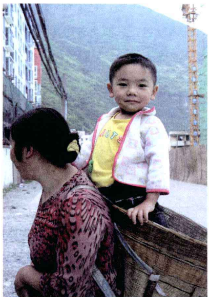
↑ 箩筐：川西一大风景