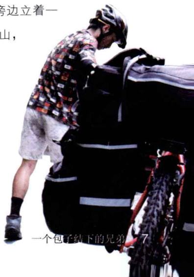
一个包子结下的兄弟