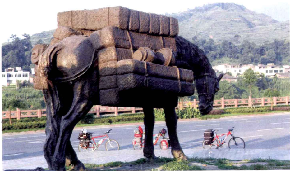
↑ 雅安茶马古道雕塑

雅安以三雅闻名：雅雨、雅鱼、雅女。天晴，无缘见识雅雨；雅鱼太贵，没吃；雅女嘛，在街上还真遇到了几位，只可惜我们还要一路西行，实在不能发生什么故事。