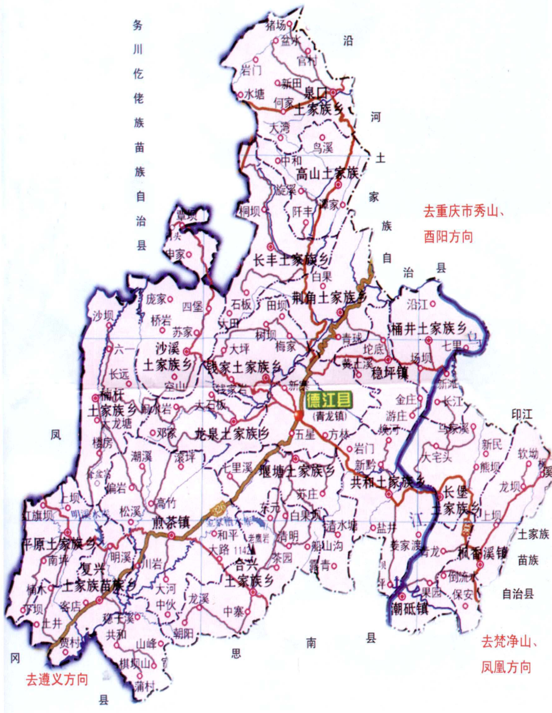
德江县行政区划和交通图