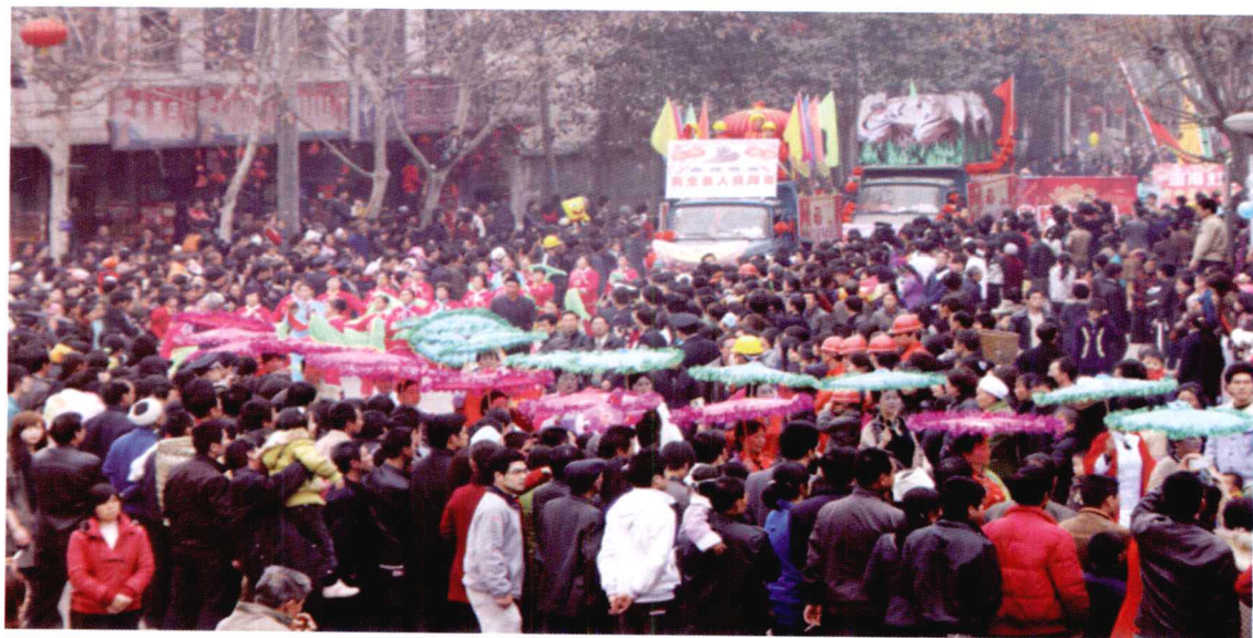
游行表演队伍一角