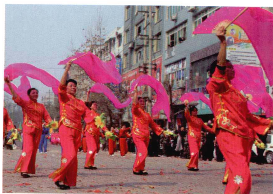
游行表演队伍一角