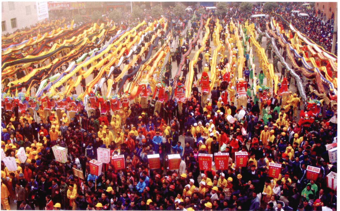
2010年2月25日，出灯仪式现场