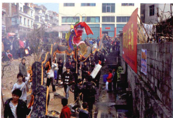
2010年2月22日，在蒲家池水井举行龙起水仪式