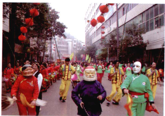
游行表演队伍一角