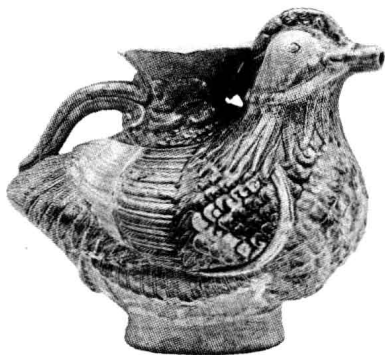
1977年内蒙古赤峰市征集的辽鸳鸯形 三彩壶(《契丹王朝》第285页)