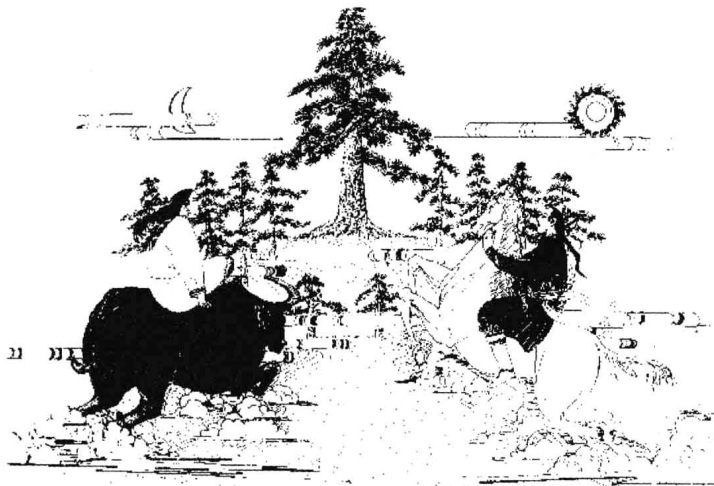
青牛白马图(明《施甸长官司族谱》卷首)

从北魏到隋唐五代,契丹经历了“古八部”、大贺氏、遥辇氏三个发展阶段。北魏时,为契丹“古八部”时期,八个部落各自活动。至唐朝初年,契丹八部组成部落联盟,先由大贺氏、后由遥辇氏经“世选”出任可汗,是为大贺氏八部和遥辇氏八部时代。五代时,遥辇可汗诸部之一的迭刺部渐渐强盛起来,后来建立辽朝的