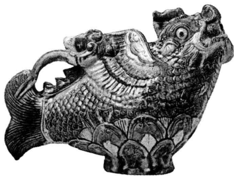
1975年内蒙古科尔沁左翼中旗征集的摩 羯三彩壶(《契丹王朝》第286页)

913年,刺葛、迭剌、安端等人又发动了比前两次规模更大的叛乱,企图杀害阿保机,取而代之。阿保机发觉他们的密谋后,十分愤怒地说:“你们开始图谋叛乱,我饶恕了你们,让你们改过自新,可是你们不知悔改,一再反叛,对我不利。”阿保机在妻子述律平的协助下,一举平息叛乱,不过也付出了沉重的代价。阿保机率领的平叛军,久出在外,供给不足,士卒靠煮马驹、采野菜为食,牲畜死者十之八九,物价腾升十倍。