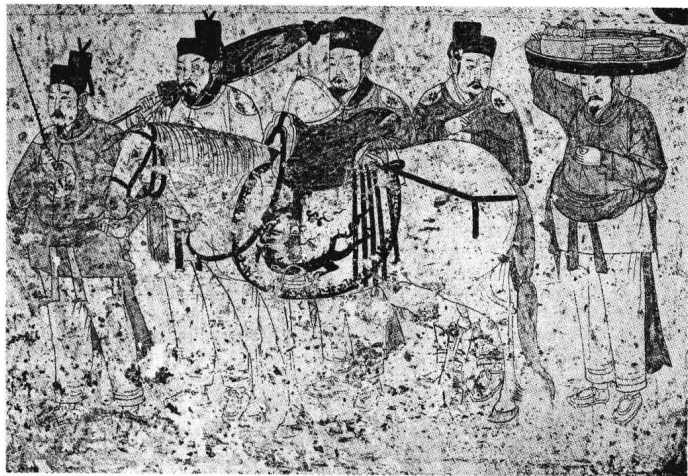
辽张世卿墓壁画中的出行图(《宣化辽墓壁画》第55页)