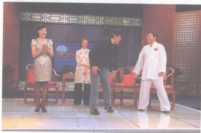
陈禾堰教申军谊功法