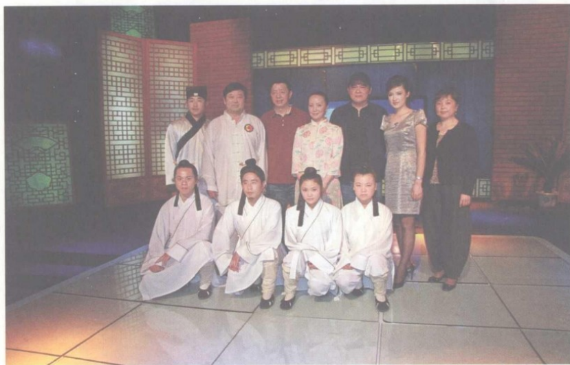
节目全体人员合影