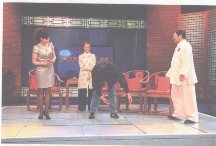
陈禾堰教申军谊松脊柱