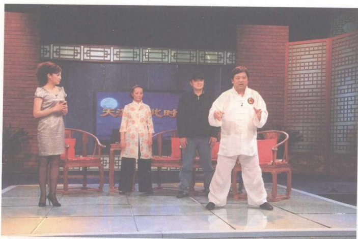
陈禾堰教大家松脊柱