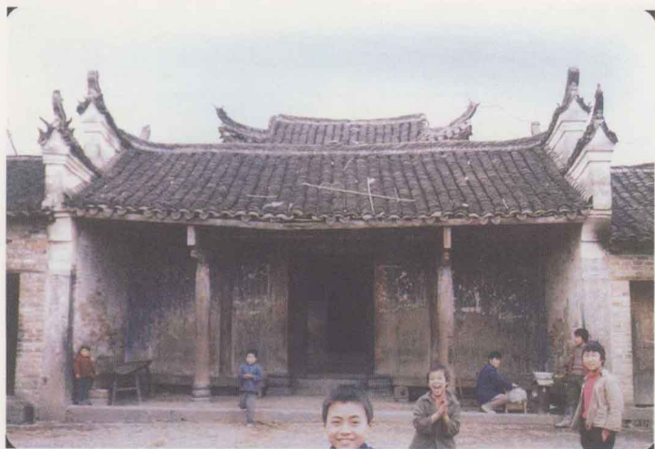
圖五 村落一宗族大門