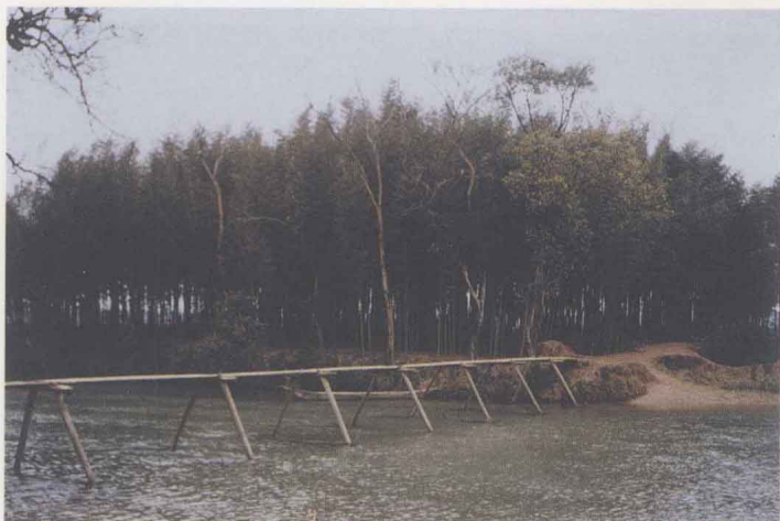
圖三 上江墟小橋流水