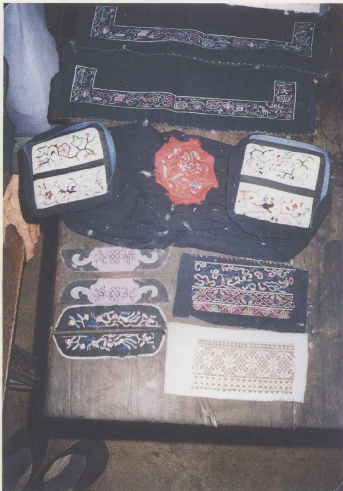
圖十一 傳統刺繡——婦女衣飾、鞋飾、枕套