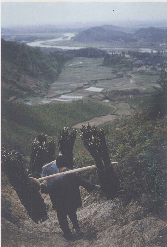
圖十 從嶺上砍柴下山