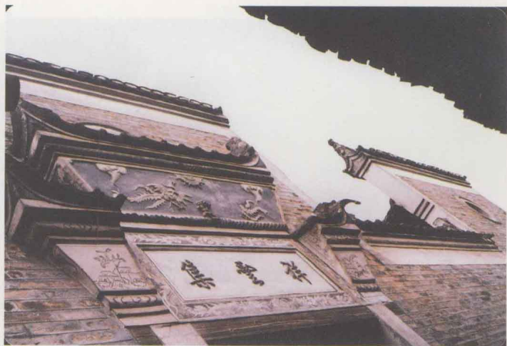
圖四 村屋門楣的題字和雕飾