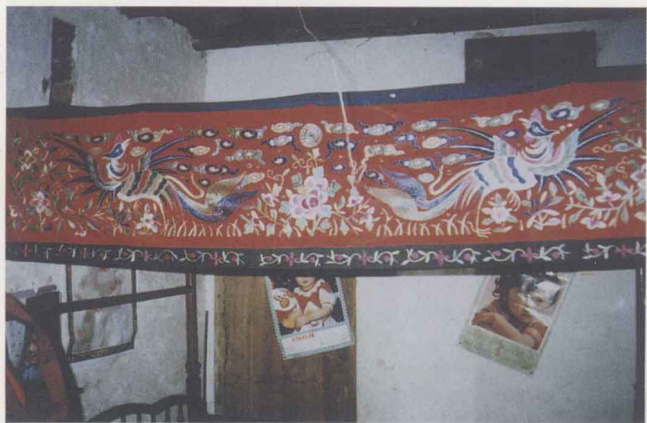
圖六 傳統刺繡——床帳