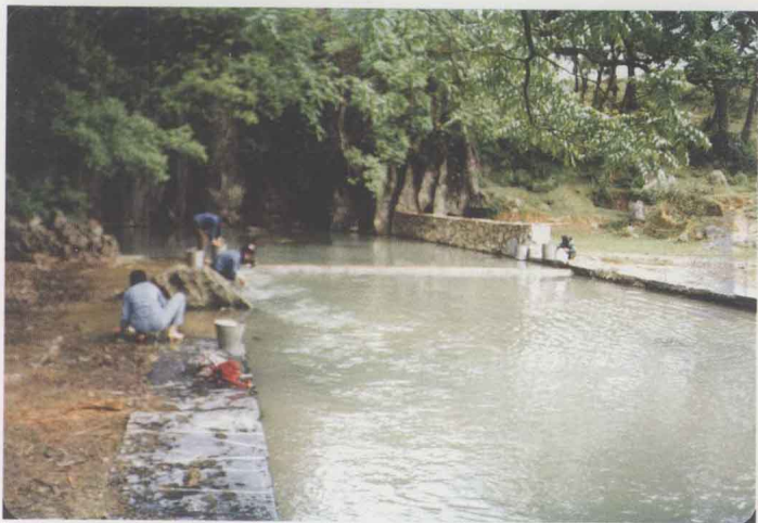
圖七 婦女在井邊洗衣