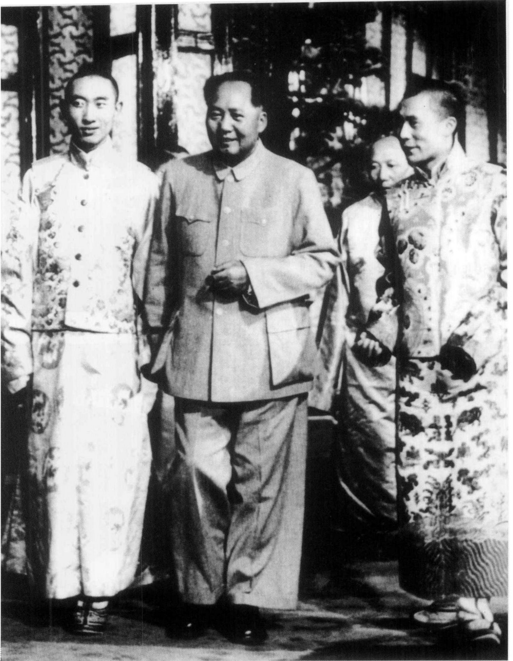
毛泽东与达赖喇嘛、班禅额尔德尼亲切交谈