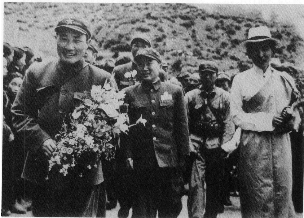
1951年7月，18军军长张国华（左一）、西藏地方政府首席和谈代表阿沛·阿旺晋美（右一）参加和谈后到达昌都，受到王其梅（左二）及昌都群众的热烈欢迎。