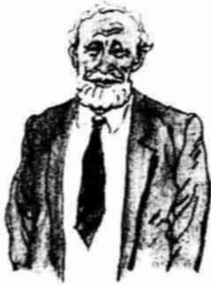
an old man