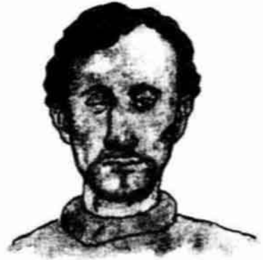
a one-eyed man