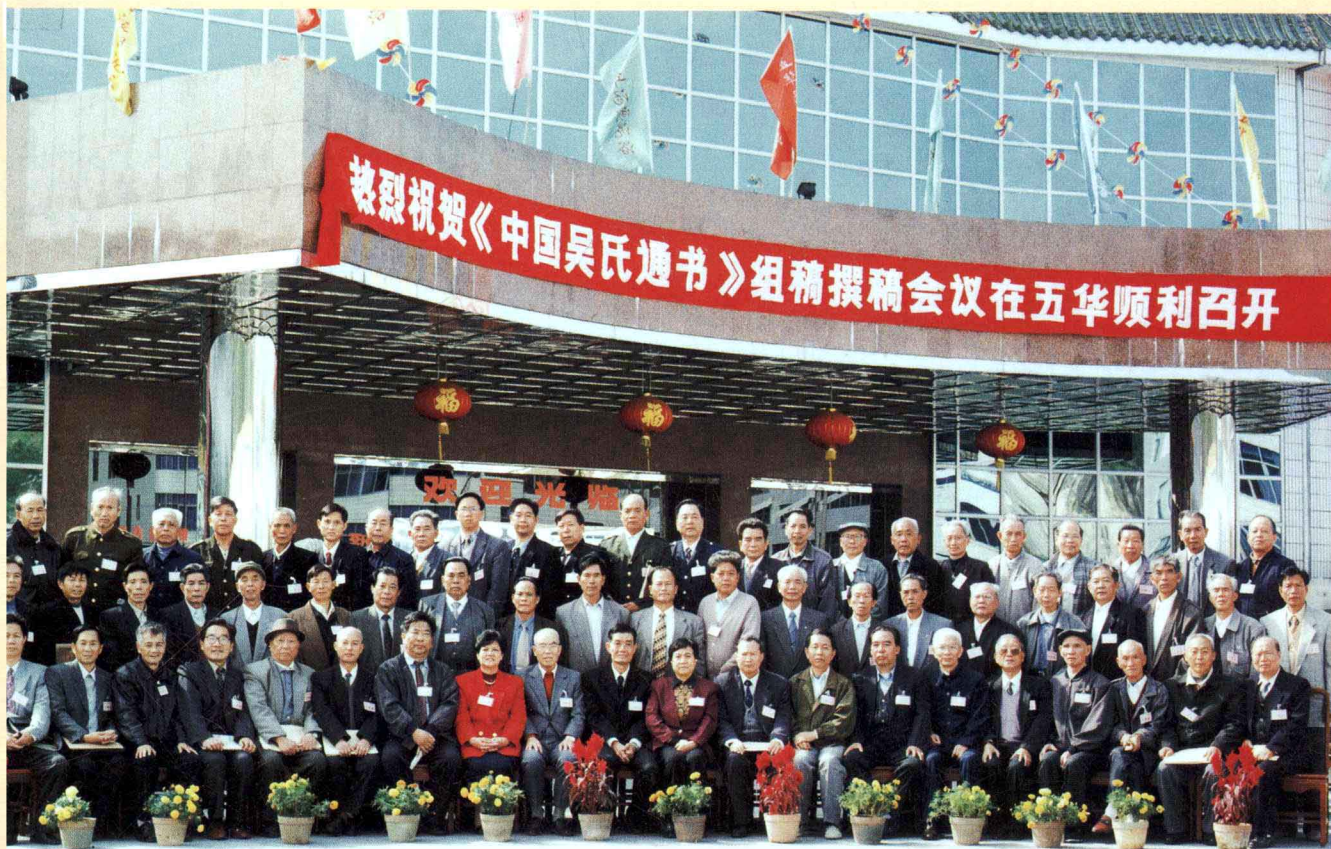
《中国吴氏通书》编委会部分委员留影 99.11.29.于广东五华