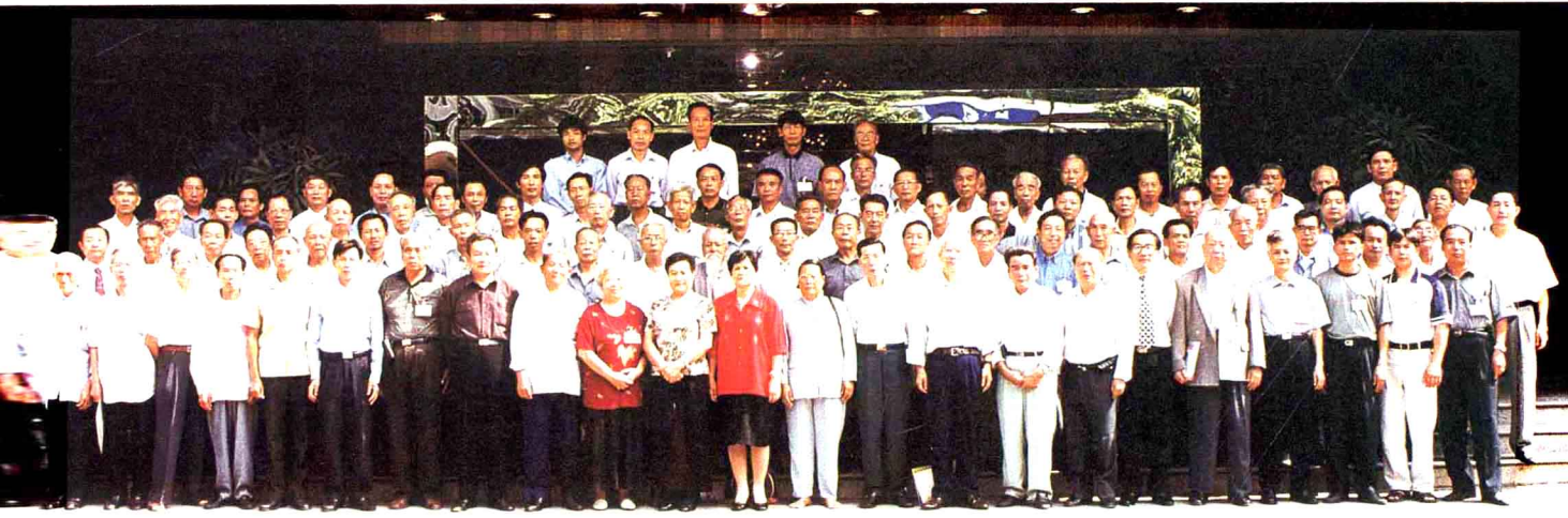
参加中华吴氏历史文化学术研讨会全体代表合影留念 2001.10.27 于广东潮州