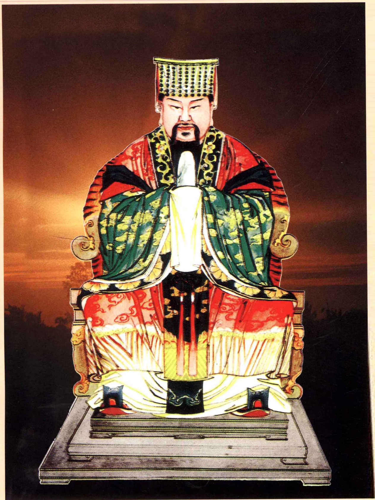
恭孝王仲雍公仪像