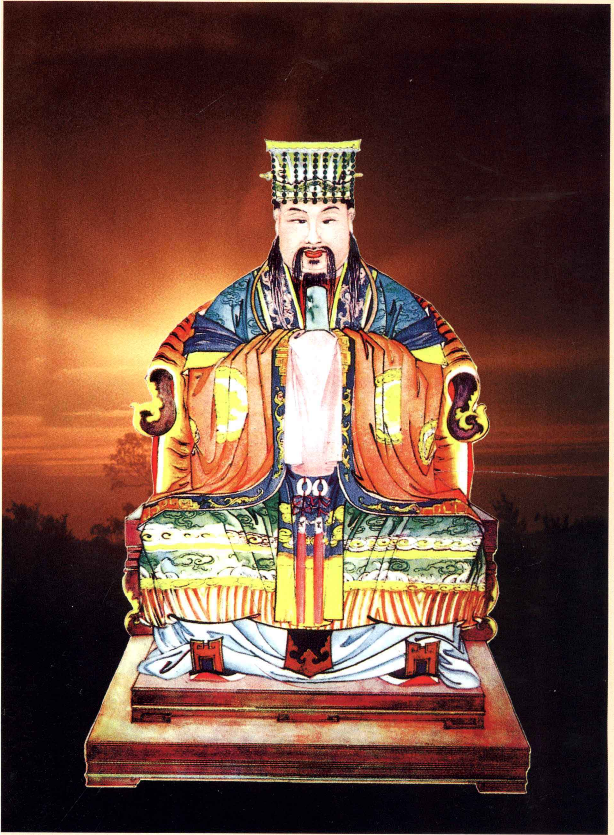
三让王太伯公仪像