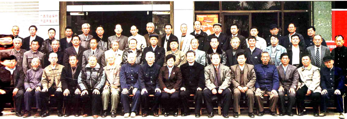
《中国吴氏通书》编纂委员会组稿撰稿工作汇报会代表合影 1999.12.28 于广西南宁