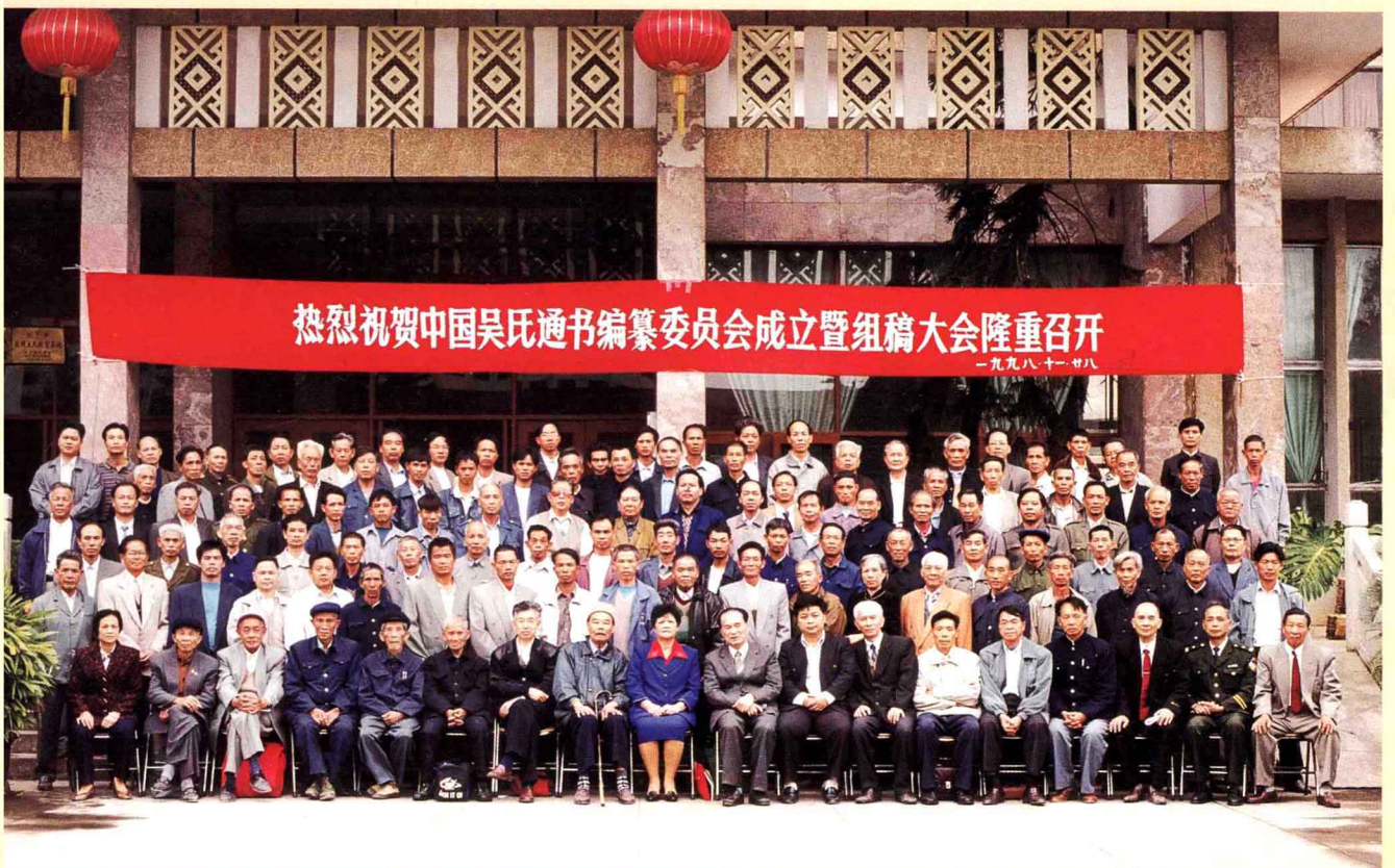
《中国吴氏通书》编纂委员会成立暨组稿大会全体代表合影（二）