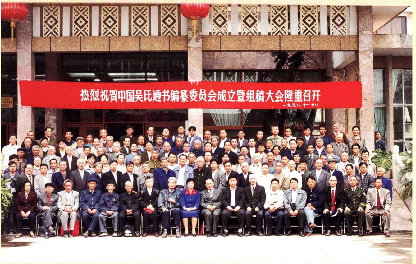
《中国吴氏通书》编纂委员会成立暨组稿大会全体代表合影（一）