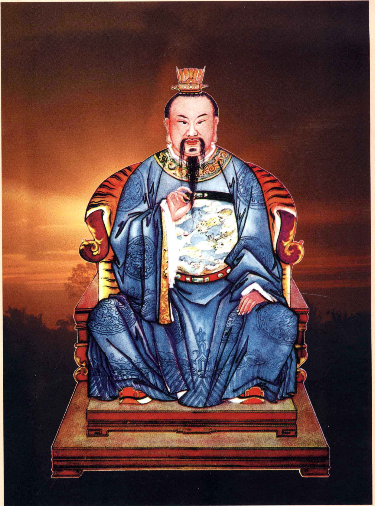
延陵王季札公仪像