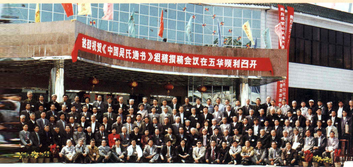
——一九九九年十一月二十九日于广东五华留影（二）