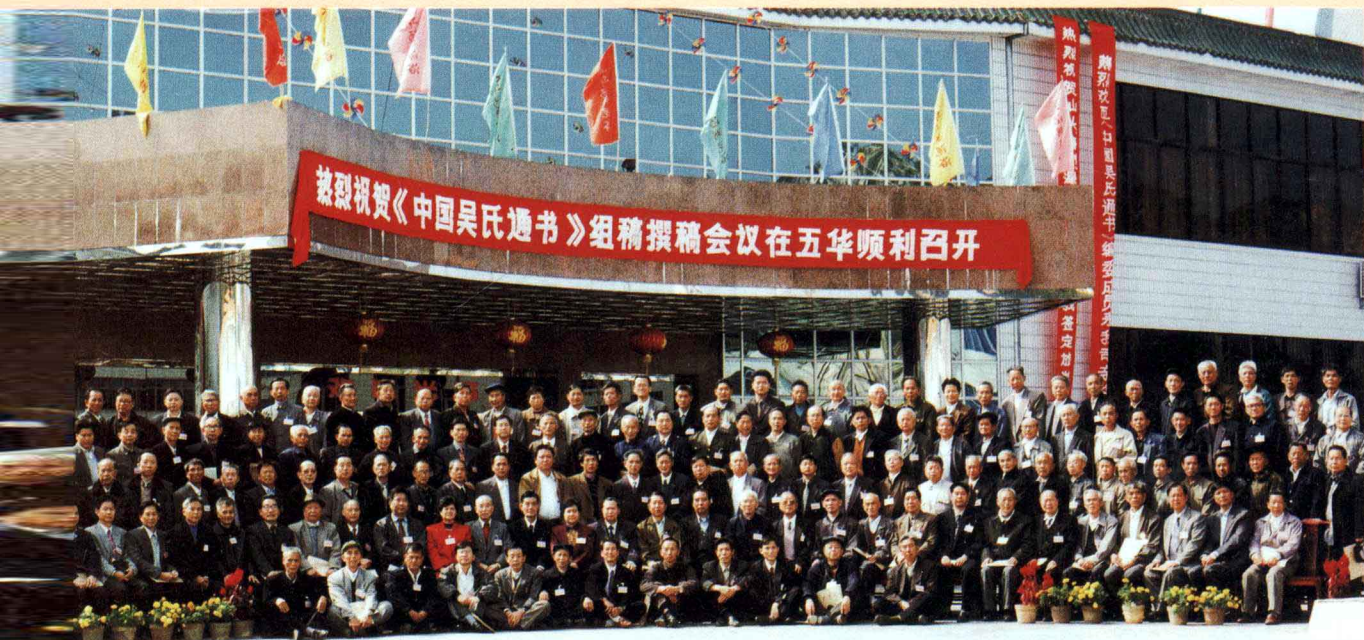
——一九九九年十一月二十九日于广东五华留影（一）