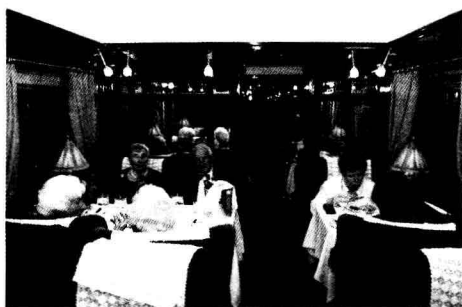
▶ 圖片說明：東方快車是著名的高品質豪華旅遊列車，本圖為東方快車內部一景。

西元 1825 年英國的第一條鐵路試車成功，許多城市因火車經過而繁榮，並帶動地方經濟及移民潮，甚至促進國家統一。東方快車 (Orient Express) 行駛巴黎至伊斯坦堡，橫貫歐洲大陸，是著名的高品質豪華旅遊列車。青藏鐵路、西伯利亞鐵路實踐人類的夢想，遊客得以探索人跡罕至的遙遠美麗淨土。