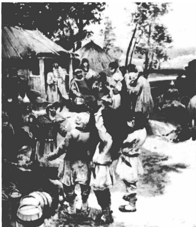
巡行征赋中的伊戈尔（坐着的那位）