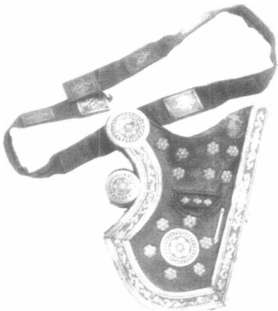
蒙古骑兵用的箭袋

集体游牧方式逐渐为个体游牧代替。私有财产积聚，出现贫富分化，在蒙古氏族成员中产生出显贵家族，其代表人物被称为“那颜”。那颜拥有自己的战士，他们被称为“那可儿”。那可儿为那颜服役、征战，“那颜”则供给他