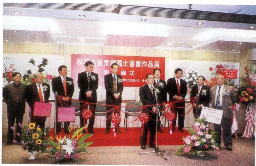
1991年12月在香港举办大型书画个展，中国驻香港新华社副社长王凤超前来剪彩