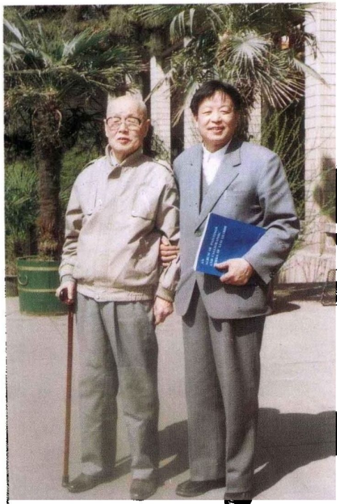
1989年罗国士和国画大师何海霞合影 于中国美术馆