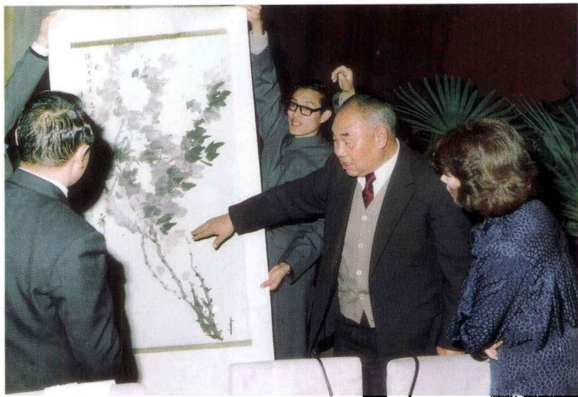
1985年陕西省省长李庆伟将罗国士先生的“月季花”赠送给法国总统夫人米特朗达尼埃尔