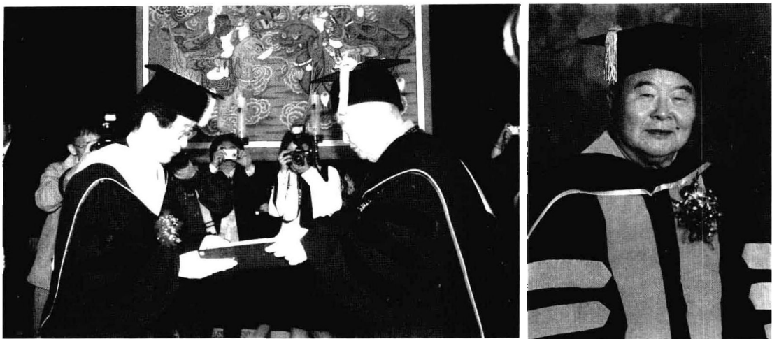
2004年，韩国东国大学赠星云大师荣誉哲学博士学位，由校长洪起三颁发。（左） 星云大师从未拿过一张正式的学校毕业文凭，却获得了10顶博士学位桂冠。（右）