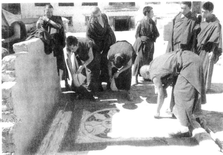
拉萨是一幅流动画

云在云的峡谷中像白鲸一样游向前方，遇到峡谷被云堵住时，鲸鱼就化在云层中了……当飞机上见着的这种景象被地面清澈、弯曲的河流所替代，就到了贡嘎，也就到了拉萨。