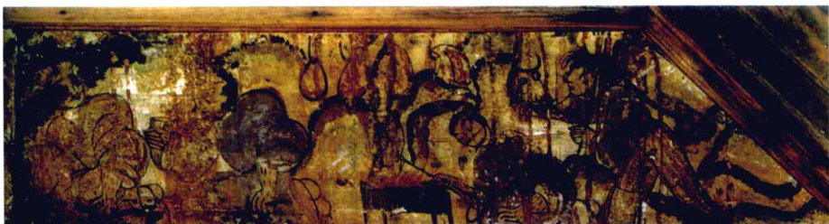
图2-6 烧沟汉墓壁画《鸿门宴》

T形帛画以引魂升天为主题，分三段描绘了天上、人间、地下的景象。画面构图饱满有序，人物形貌刻画生动，体现了古人对天国的想象和追求永生的幻想。手法上，先用流畅圆润的线条勾出轮廓，再赋以各种颜色，其中有采用朱砂、石青、石绿等矿物颜料彩绘，色调沉稳鲜艳，具有很好的装饰效果，充分反映了西汉绘画所达到的高超水平。卜千秋墓壁画中的《卜千秋夫妇升仙图》，描绘的是男女墓主人分别乘龙持弓，骑三头神鸟，在各种神兽的簇拥下飘然升仙的场景。画面气魄雄大，运笔勾线之轻重、虚实、顿挫恰如其分，较T形帛画更具速度感与运动感。烧沟61号墓壁画主要以《二桃杀三士》、《鸿门宴》等历史故事著称，生动表现了不同性格的人物和戏剧性的矛盾冲突，堪称西汉人物画艺术的杰作。