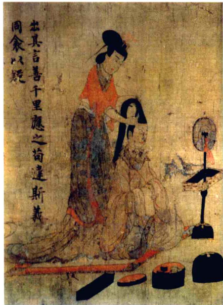
顾图2-8 顾恺之《女史箴图》局部

顾恺之（约348—409），东晋画家，字长康，小字虎头，晋陵无锡（今属江苏）人，时有“才绝、画绝、痴绝”之称。所作人物，注重细节，意在传神。传世画作有《女史箴图》、《洛神赋图》、《列女仁智图》等。