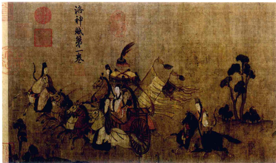
图2-7 顾恺之《洛神赋图》局部

烈女故事图》，山西太原北齐娄睿墓壁画《出行图》等。其中《出行图》以长卷式构图组成一幅现实生活、古代神话传说和儒道释合流一体的宏伟画面。突出体现单线勾勒、重彩渲染的传统人物画造型特征。线条洗练遒劲，注重表现人物的动态和神采。绘画技巧已臻于成熟。