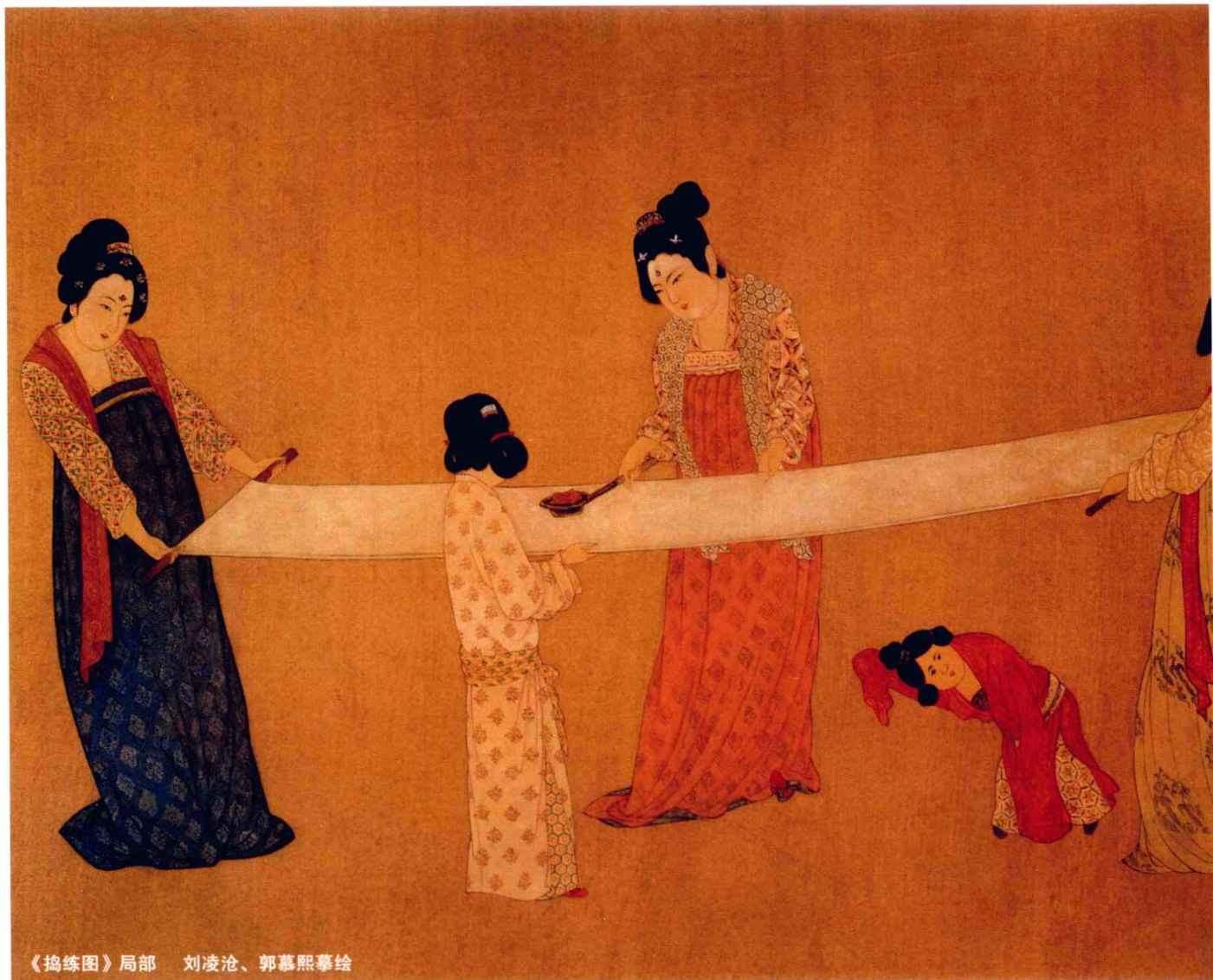
《捣练图》局部 刘凌沧、郭慕熙摹绘

课程结束后，将每位学生的优秀作业进行拍摄，以年级、课程分类，建立教学作业图库存档。