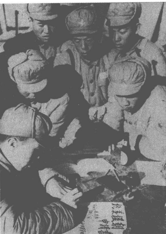
▲中国人民解放军指战员纷纷上书，积极要求奔赴抗美援朝最前线。

车慢慢地向前走，穿过一座被炸平了的都市。前面清亮悦耳的歌声又飘过来了：“东方红，太阳升……”车到跟前，原来是一队人民军的女战士。她们全副武装，长长的行列，排在路的两边。我们和着她们的歌声和欢呼声一起唱着喊着。突然她们手往上一扬，无数个苹果朝车上飞来，我们大声喊：“谢谢你们！我们要多打掉几架飞机来回报你们！”