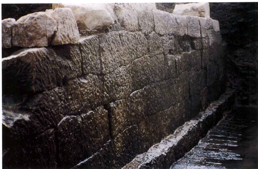
图八 南宋太庙遗址之东围墙遗迹 (西北—东南)