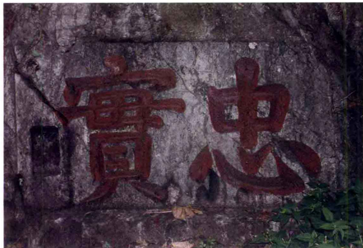
图四 凤凰山东麓宋高宗楷书石刻题记