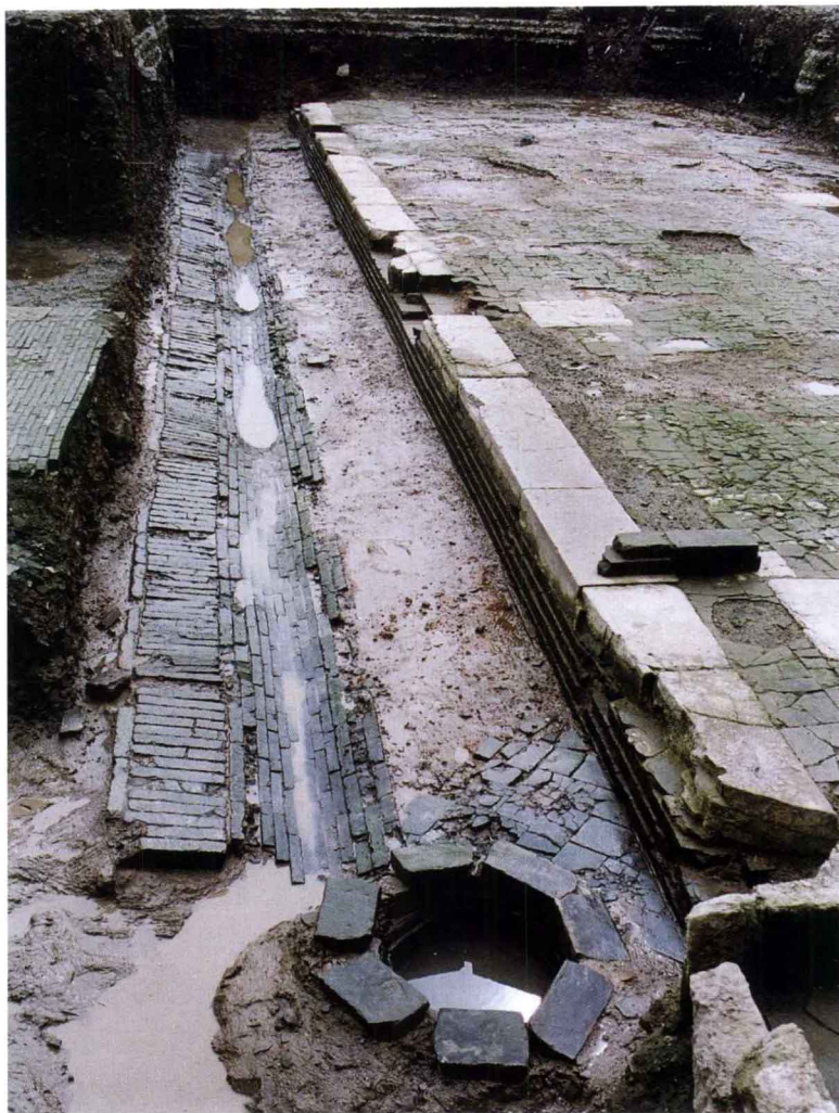
图一〇 南宋临安府治遗址之西厢房 及散水遗迹（北—南）

设计巧妙、设施齐全。 以排水设施为例：太庙遗址东围墙内侧有长方砖铺筑的散水，围墙底部有由内而外、穿墙而过的排水沟。临安府治诵读书院遗址北区天井的内侧设置曲折形砖砌散水，并通过石构壶门与厅堂底部暗沟相通。恭圣仁烈皇