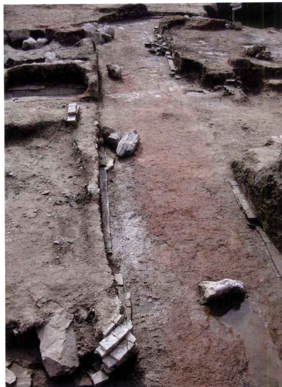
图五 南宋德寿宫遗址之大型水渠遗迹（西—东）

随着南宋御街的三度发现，基本可以确定南宋临安城的中轴线大部分位于今天的中山路一带并与之重合，中山路是由南宋御街逐步演变而来并一直延用到现在。在严官巷南宋御街的发掘过程中，我们发现御街表面有一层土质坚硬的厚约10厘