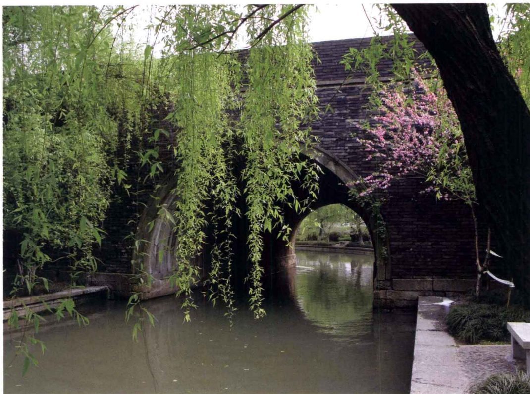
图一 上世纪90年代在原址新建的 凤山水门

至朝天门（今鼓楼）一带的御街沿线有太庙以及三省六部、枢密院、五府等重要机构，其中和宁门至六步桥路口一段实际上具有外朝的性质，是元旦和冬至大朝会时的会集排班之所。城市的中、北部是居民区和商业区。城内虽设有九厢以利管理，但官署与居民的坊巷间杂，如御史台在清河坊（今河坊街）之西，秘书省在天井巷（今小井巷）之东，五寺、三监、六院等均分布在临安城内各坊巷间。 ⑥