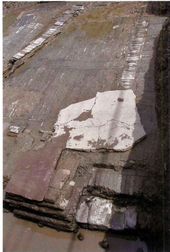
图六 严官巷南宋御街（南—北）