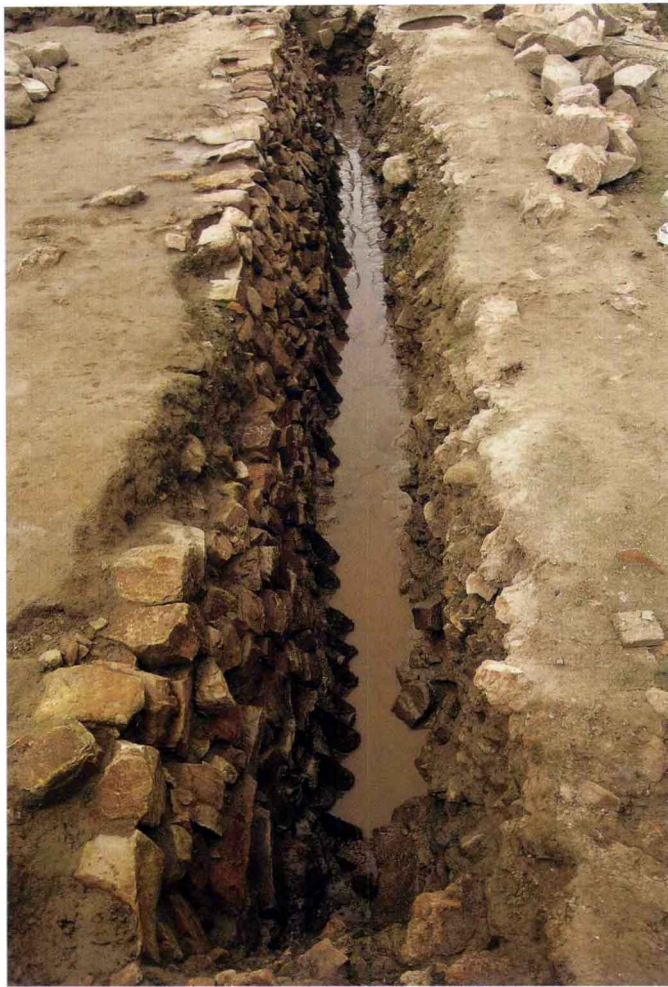
图七 临安城东城墙基础遗迹 (南—北)

两次发掘对研究五代、北宋、南宋三个时期城墙的结构和砌筑方法及杭州城市的变迁提供了重要的实物资料，也为全国重点文物保护单位——南宋临安城遗址保护范围的划定提供了重要依据。