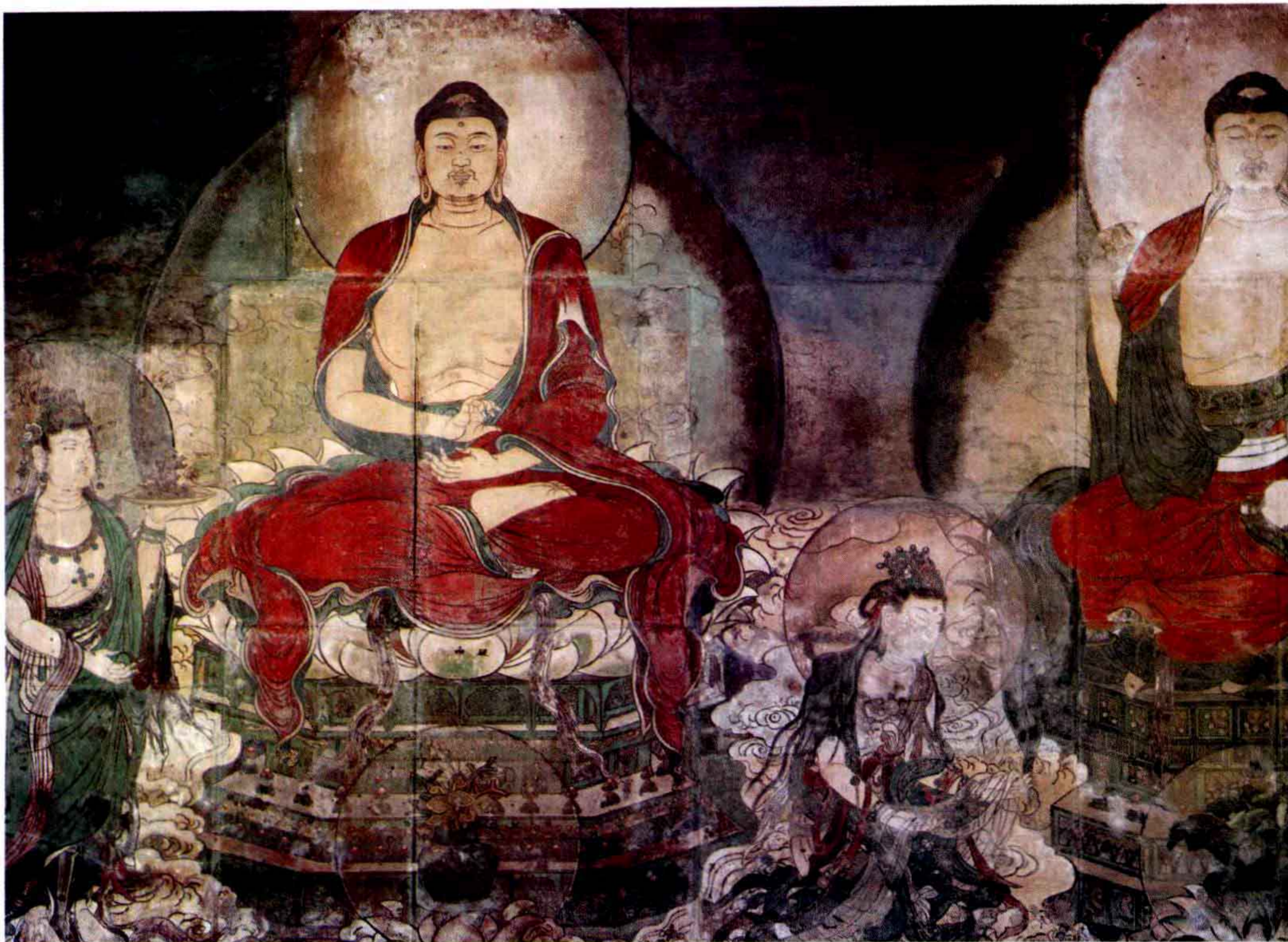
[图1] 山西稷山兴化寺元代壁画《过去七佛说法图》 〔故宫博物院藏〕

在北京故宫博物院保和殿西庑殿南端的西墙上，砌陈着原属山西稷山县兴化寺的元代壁画《过去七佛说法图》〔图1〕。兴化寺的另一铺壁画《弥勒佛说法图》，现为加拿大多伦多皇家安大略博物馆〔The Royal Ontario Museum〕所度藏；此外，兴化寺还有遗留下来的一小块壁画被收藏在稷山县博物馆 ① 〔图2〕。这是至今所知兴化寺壁画的所有遗存。兴化寺始建于公元592年。在抗日战争期间毁于火灾，现早已夷为平地 ② 。那么，现在的壁画遗存是怎样保存下来的，又是怎样流存到这几家博物馆的呢？