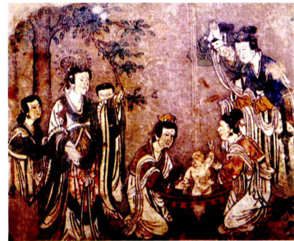
【图2】山西稷山兴化寺元代壁画《佛诞图》（局部） （山西稷山县博物馆藏）