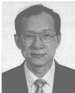
原中央电视台体育频道综合部主任 程志明