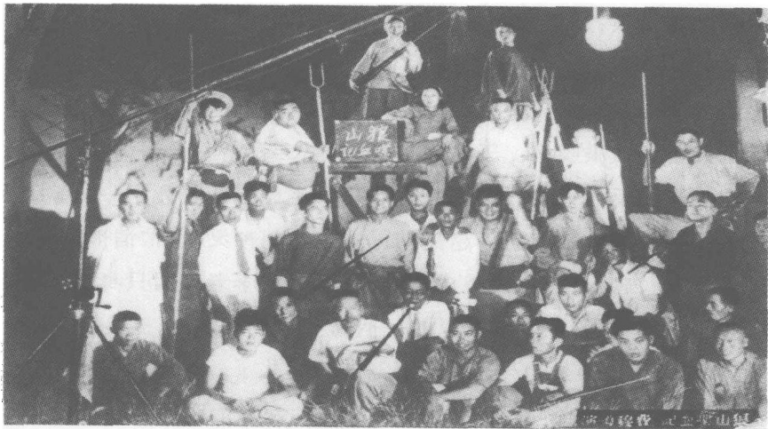
《狼山喋血记》演职员合影

这是一部优秀的“国防电影”，影射了日本侵略者像狼一样，你越怕它，它就越猖狂，所以全国人民要团结一致，抵抗侵略。该片采用了寓言形式，这在当时国民党和上海租界当局双重压制下，是一种不得已而为之的办法。编导以曲折隐晦的方式宣传了抗日思想，抨击了不抵抗主义的可耻，赞扬了民众的抗日觉悟和他们的爱国精