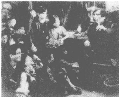
《迷途的羔羊》剧照一