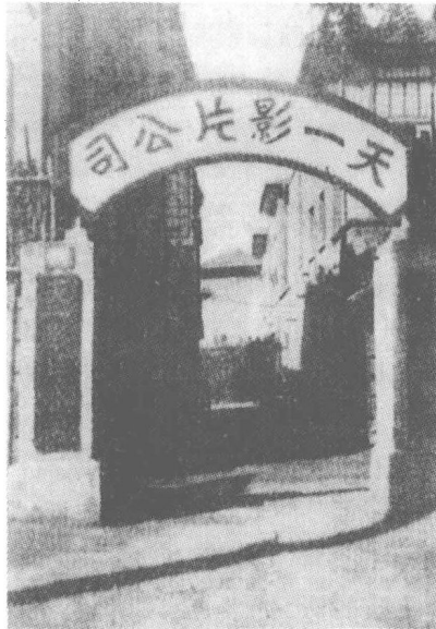
天一影片公司正门