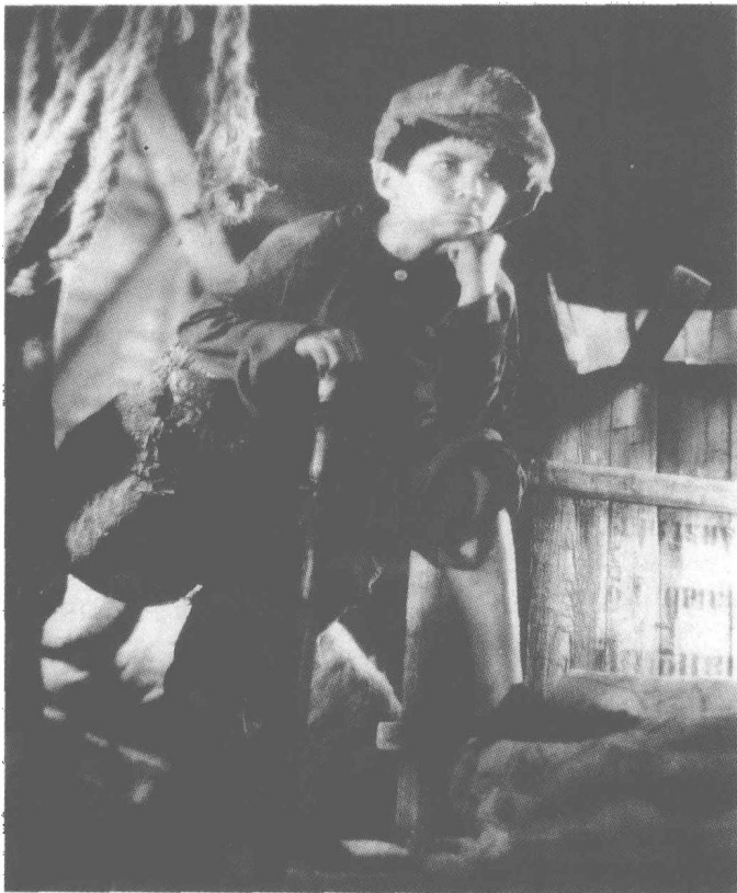
《迷途的羔羊》剧照二

认为沈慈航不该收留小乞丐作嗣子。随后，小三子因无意中撞见沈太太与姘夫偷情，于是沈太太便串通保镖，诬赖小三子偷窃钻戒。这样，小三子便终被沈慈航赶走，仗义的老仆人为他辩护，也因而一起被逐。老仆人租得一间小屋，与小三子住在一起，并收容了那些流浪的小朋友。后来老仆人饿死在路上，孩子们也被房东赶出，又流浪街头。他们因为饥饿，偷了几个面包，被警察追捕，逃到一座正在建的摩天大楼上。流浪儿们面对着茫茫上海，彷徨无助。这时，银幕上映出了孩子们惊恐含泪的脸，推出了下列字幕：“各位！