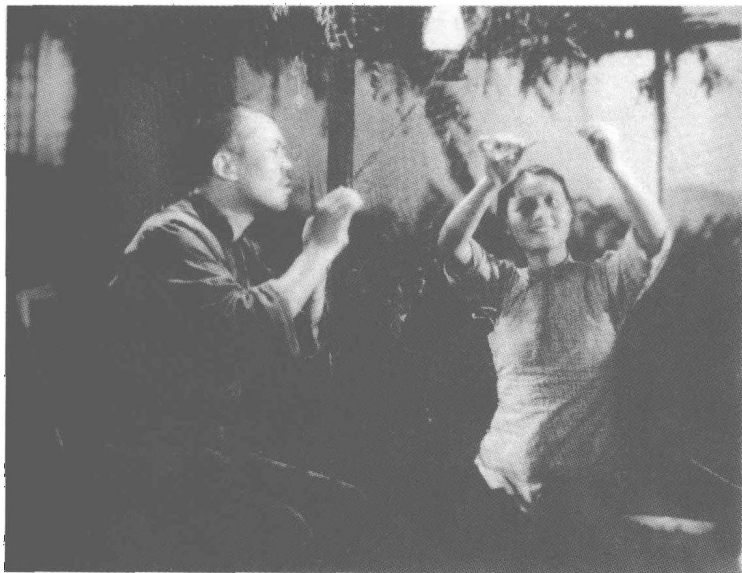
《狼山喋血记》剧照二