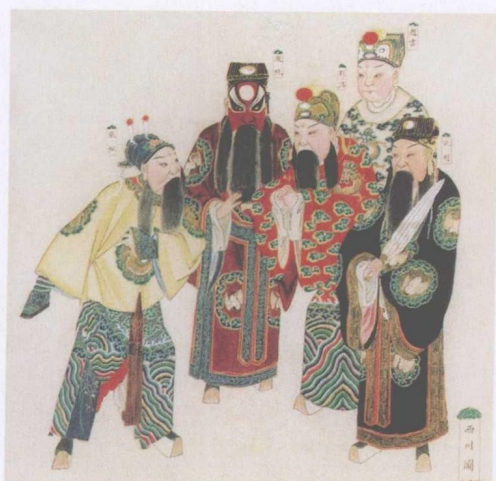
清宫昇平署戏画《西川图》