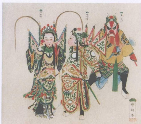
清宫昇平署戏画《穆柯寨》