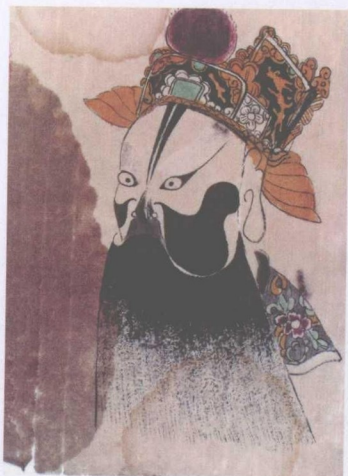
清代蒲州梆子脸谱——徐彦昭