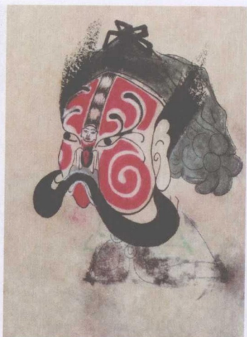
清代蒲州梆子脸谱——大妖