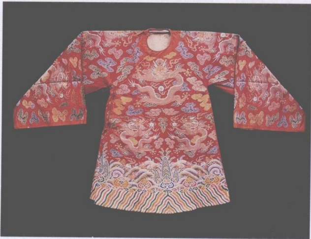
清宫戏衣——贡缎织金团龙红袍