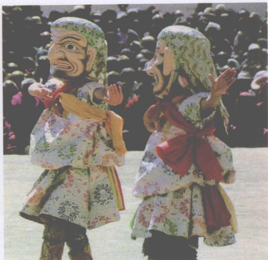
甘南南木特戏《米拉日巴》