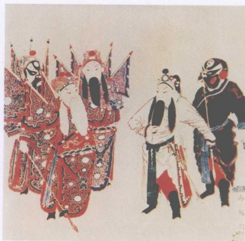
清宫昇平署戏画《南阳关》