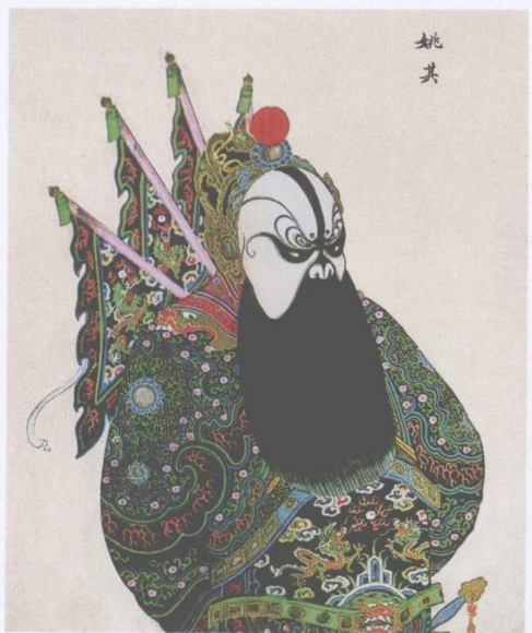
清宫昇平署扮相谱 —— 姚期