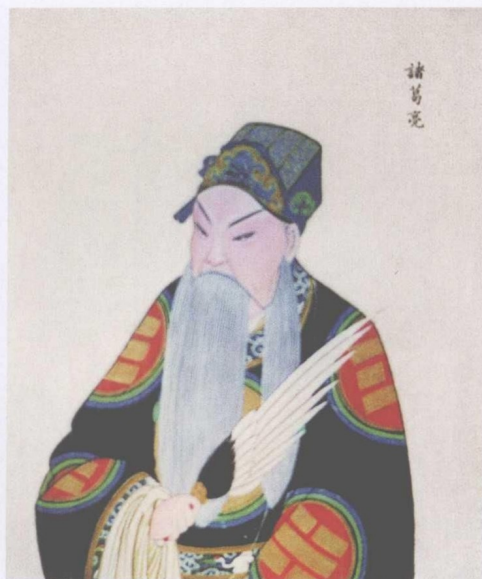
清宫昇平署扮相谱 —— 诸葛亮