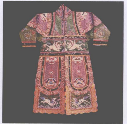
清宫戏衣 —— 织金团龙红蟒