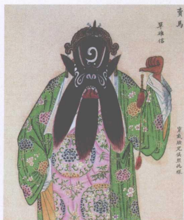
清宫昇平署扮相谱——单雄信