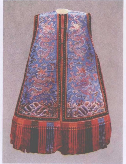
清宫戏衣 —— 排穗坎肩