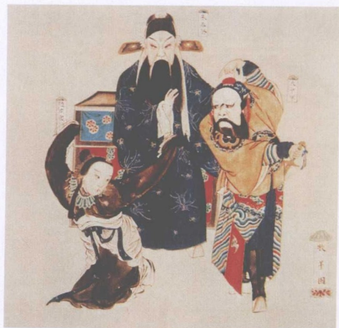
清宫昇平署戏画《牧羊卷》