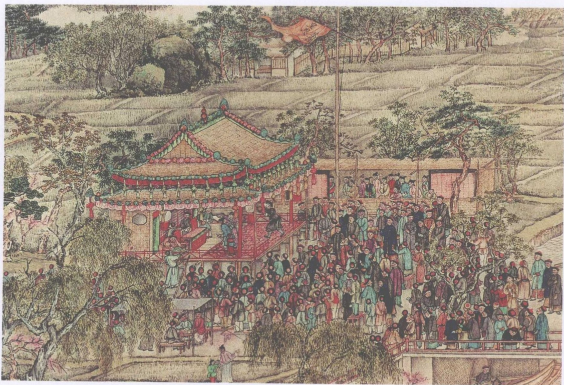
清代徐扬《盛世滋生图卷》万年台