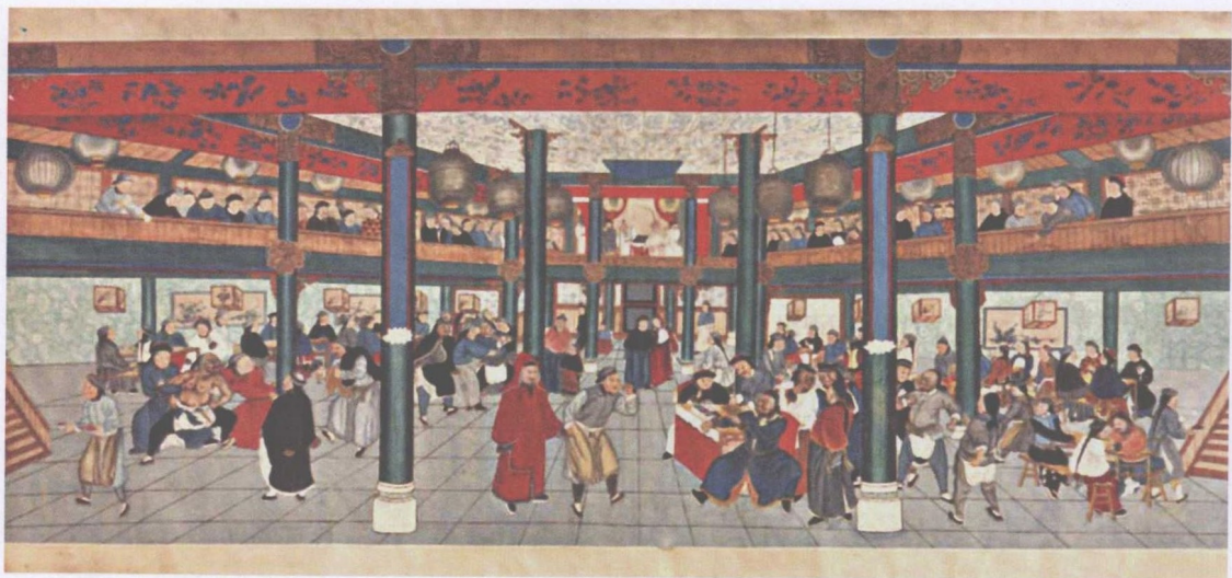
清代月明楼茶园演戏图