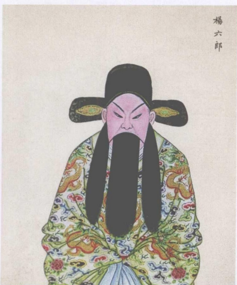
清宫昇平署扮相谱 —— 杨六郎