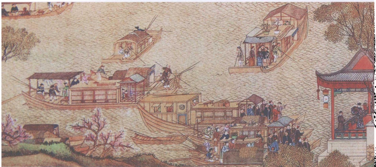
清代乾隆《南巡图》涌金门外演戏图，乾隆四十一年（1776）徐扬作