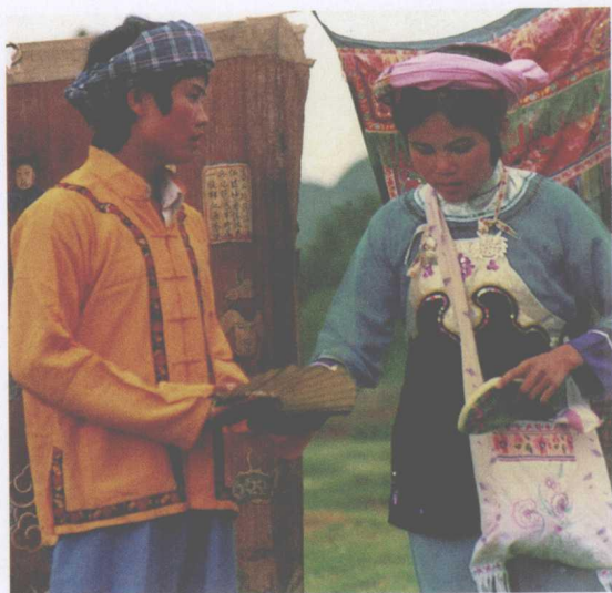
布依戏《胡喜与男祥》