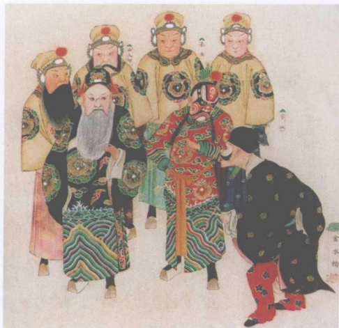
清宫昇平署戏画《金水桥》