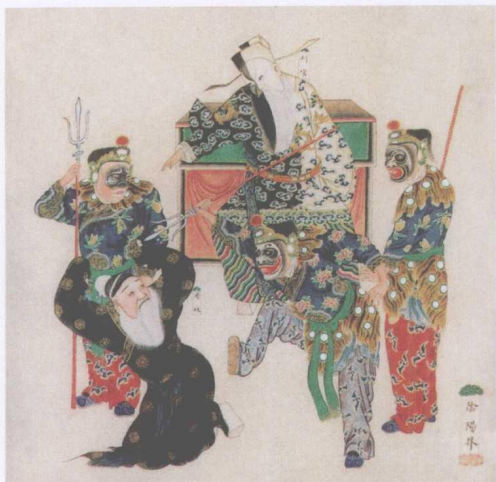
清宫昇平署戏画《阴阳界》