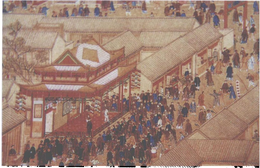
清代乾隆《南巡图》西湖畔演戏图