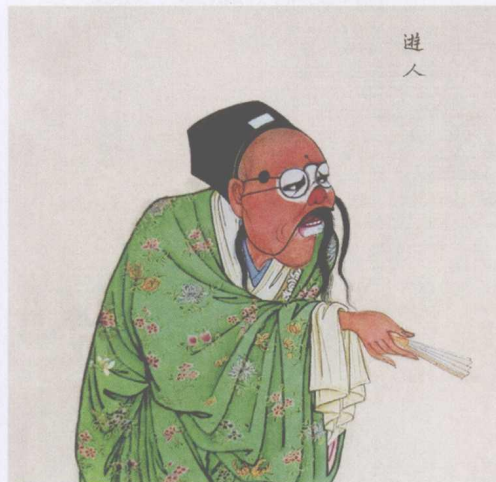
清宫昇平署扮相谱——游人