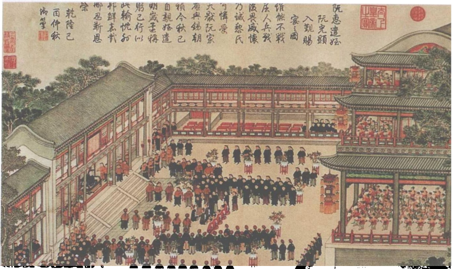
清代乾隆《观剧图》承德离宫博物馆藏