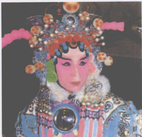
马祥麟在《借扇》中饰铁扇公主