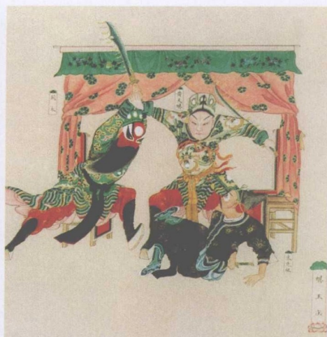
清宫昇平署戏画《霸王庄》