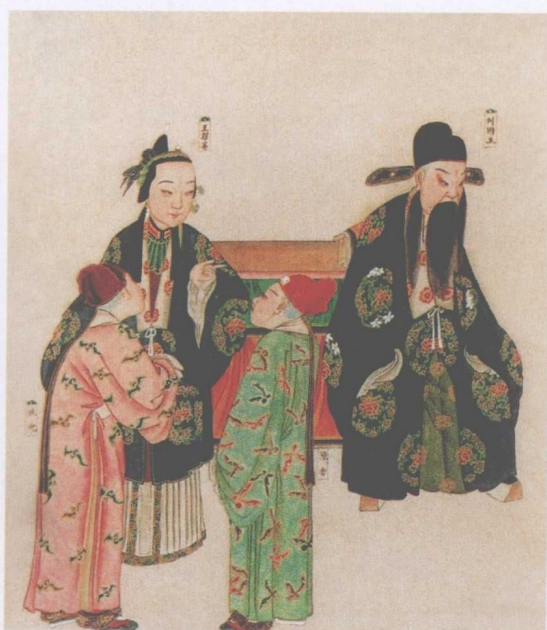
清宫昇平署戏画《宝莲灯》