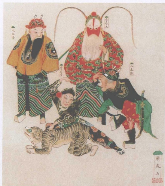
清宫昇平署戏画《飞虎山》