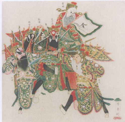
清宫昇平署戏画《阳平关》