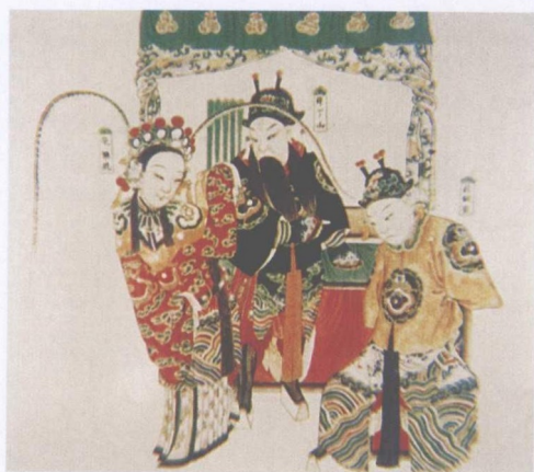
清宫昇平署戏画《芦花河》