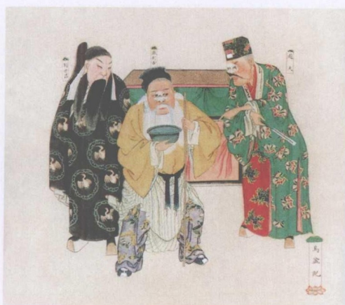
清宫昇平署戏画《乌盆记》