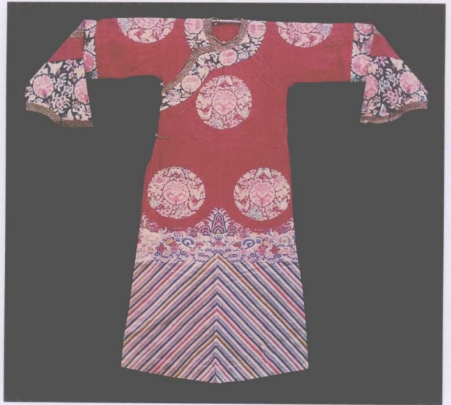
清宫戏衣——纳纱女旗袍