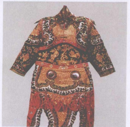
清宫戏衣 —— 周仓靠