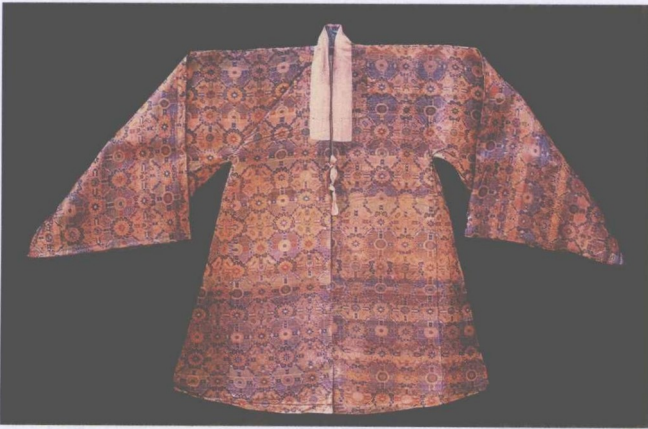
清宫戏衣 —— 天华锦男帔