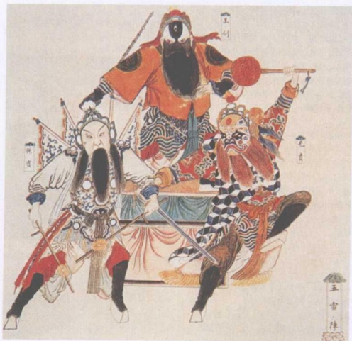
清宫昇平署戏画《五雷阵》