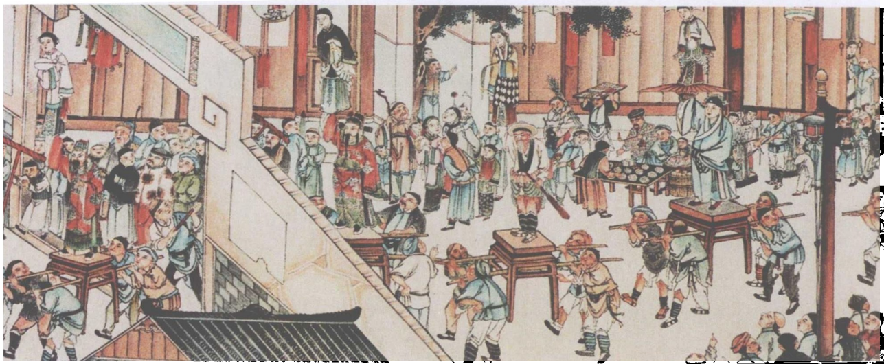
清代四川绵竹戏曲年画《迎春图》