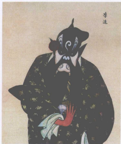
清宫昇平署扮相谱 —— 李逵