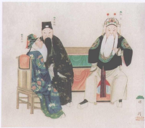
清宫昇平署戏画《文昭关》