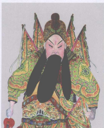
清宫昇平署扮相谱——秦琼