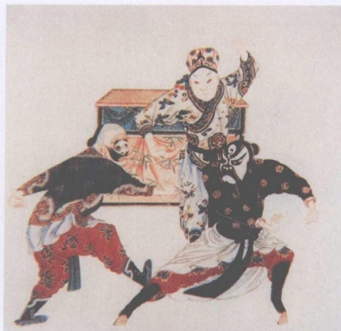
清宫昇平署戏画《三岔口》