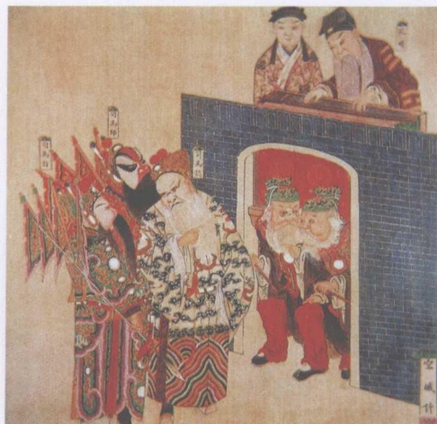
清宫昇平署戏画《空城计》