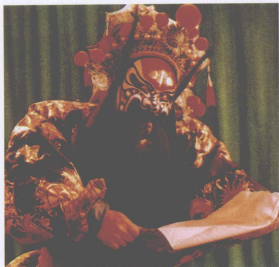
侯永奎在《天下乐·嫁妹》中饰钟馗