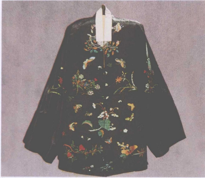
清宫戏衣 —— 女帔