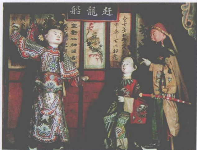
平遥纱阁戏人《恶虎村》