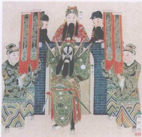
清宫昇平署戏画《取荥阳》