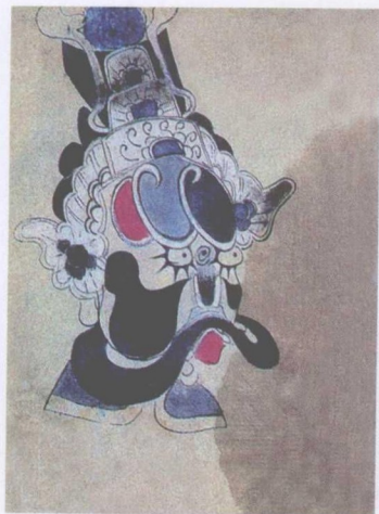
清代蒲州梆子脸谱——荆轲