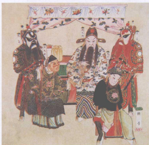
清宫昇平署戏画《斩子》