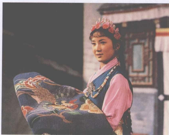
藏戏《朗萨雯蚌》中的朗萨