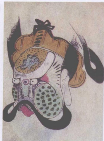
清代蒲州梆子脸谱——王彦章