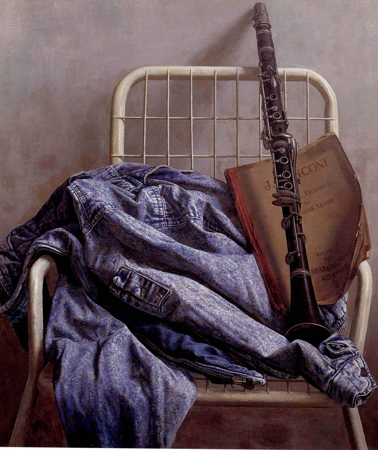
乐手 1998年 布面油彩 90 × 90cm