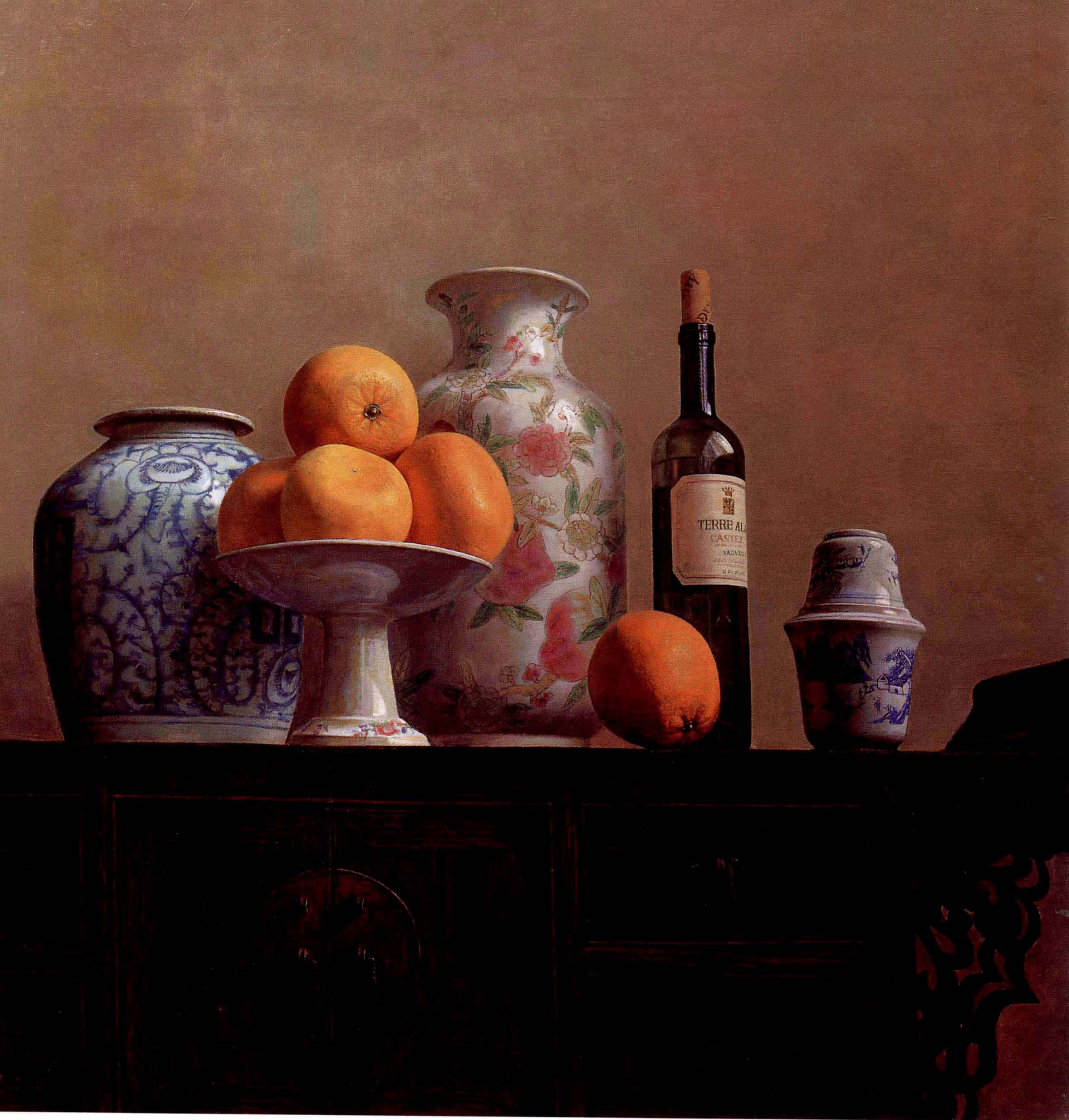
静物 1999年 布面油彩 90 × 90cm