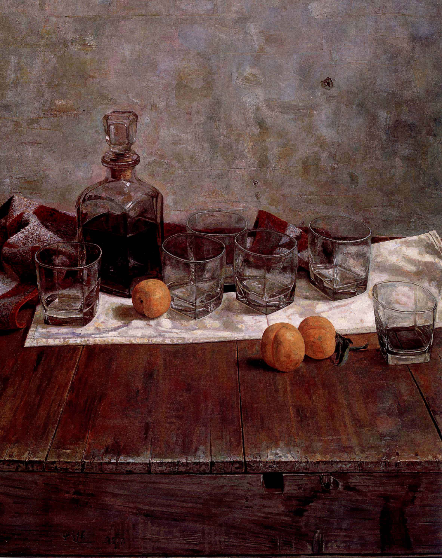
法国干红 1998年 布面油彩 100 × 80cm