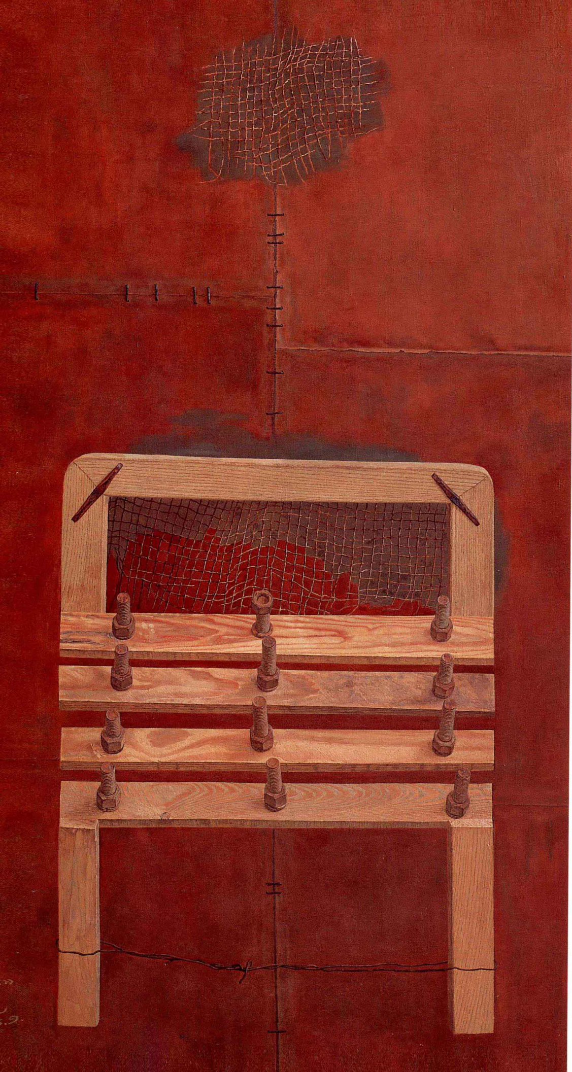
大补 1995年 布面油彩 165 × 85cm