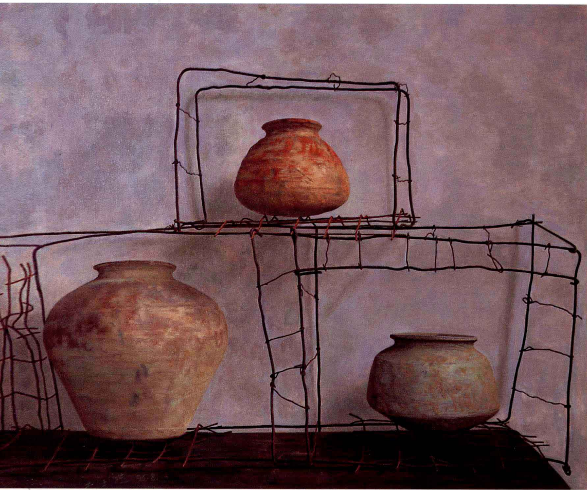
汉罐 1996年 布面油彩 80 × 100cm