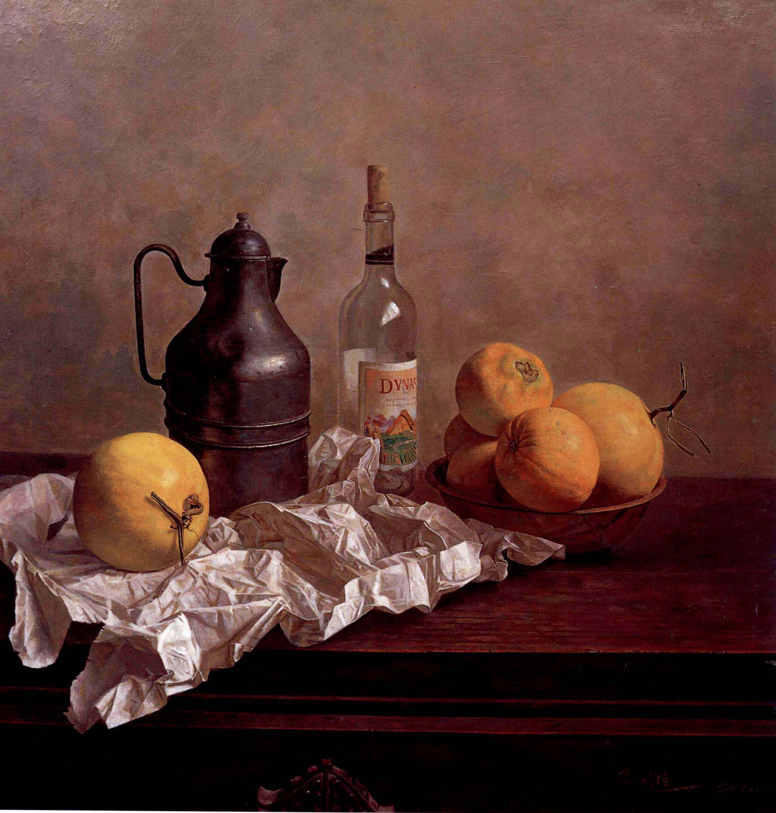
静物 1998年 布面油彩 90 × 90cm