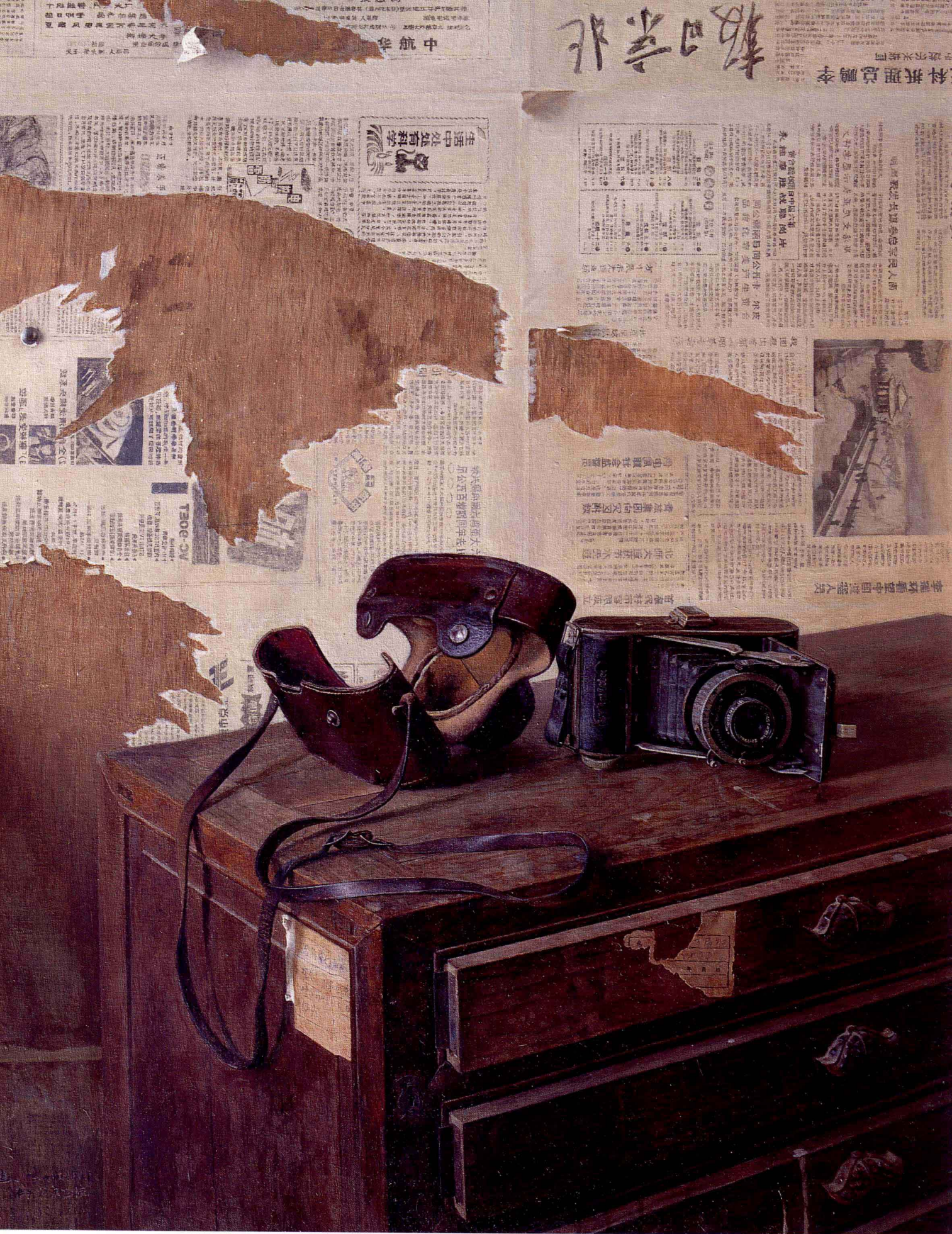
旧相机 1991年 布面油彩 100 × 80cm