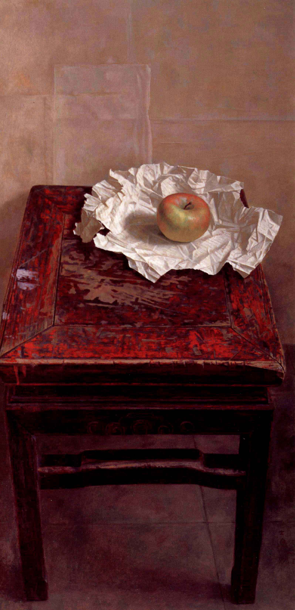
红凳子·青苹果 1998年 布面油彩 120 × 60cm