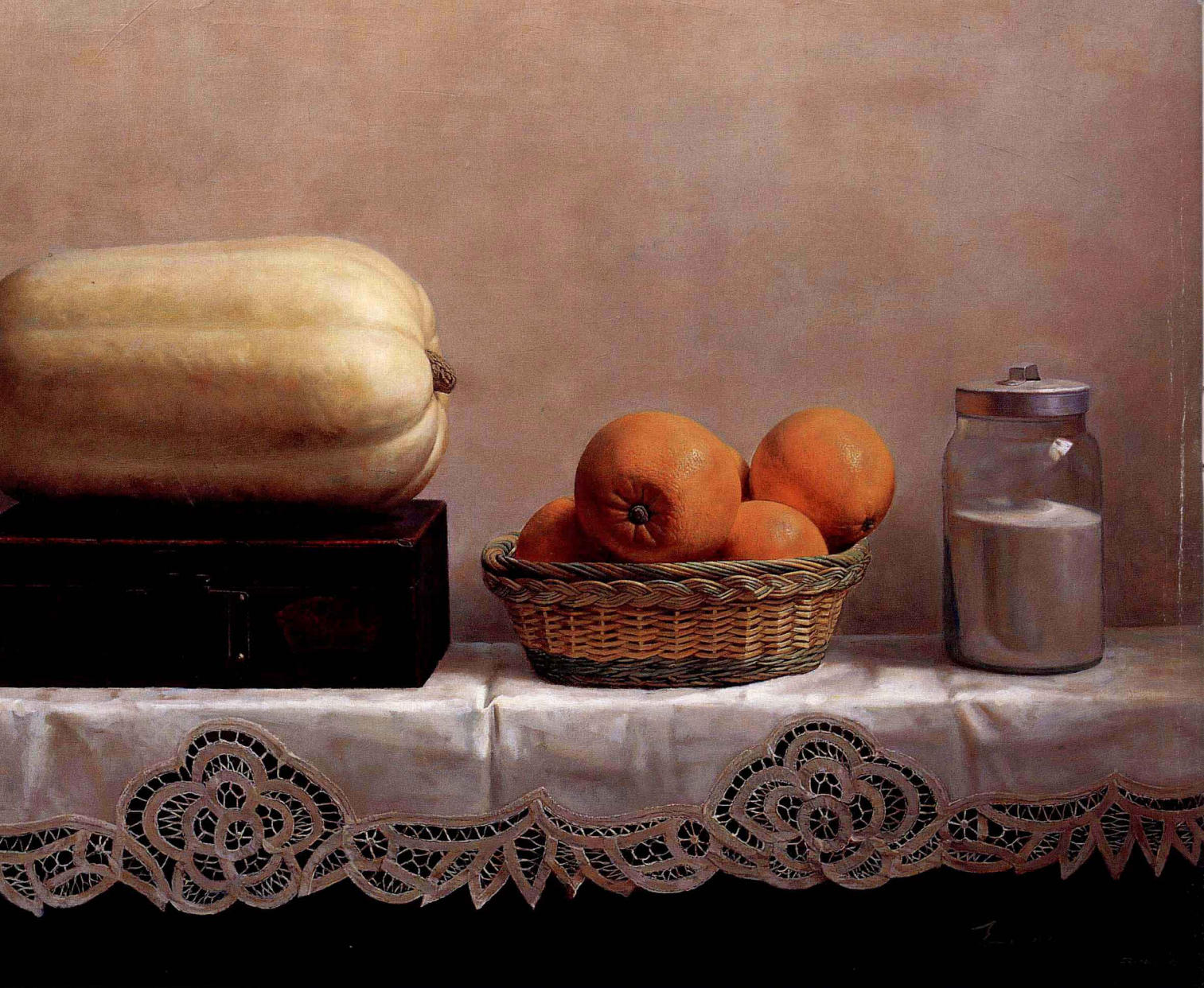
丰收 2000年 布面油彩 80 × 100cm