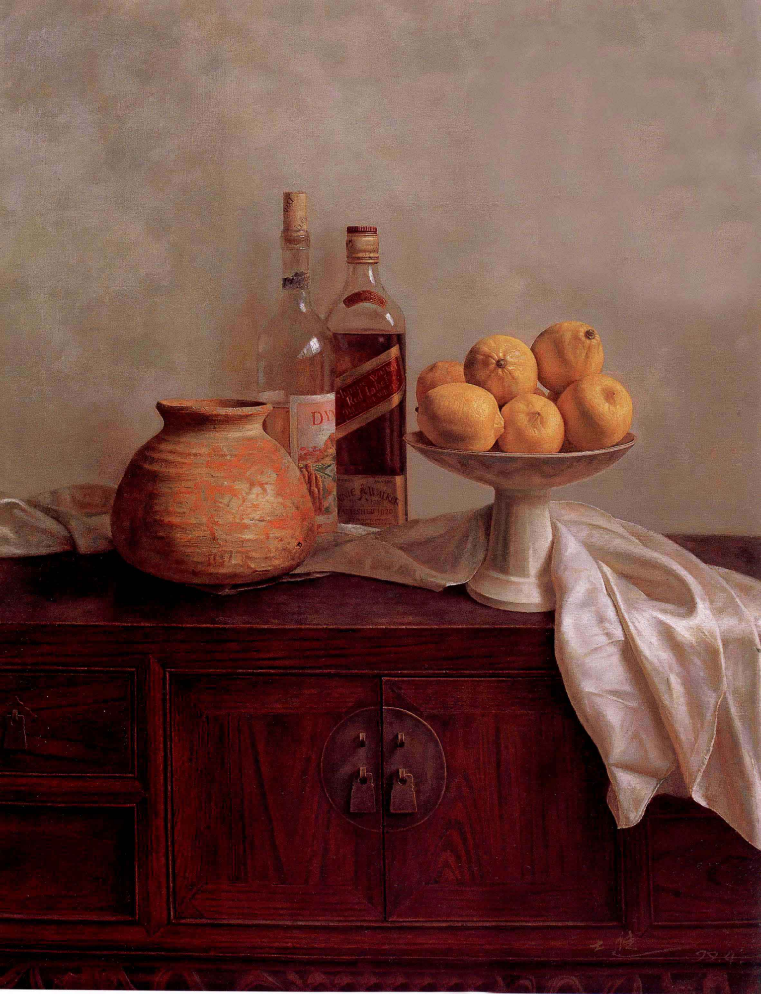
静物 1999年 布面油彩 100 × 80cm