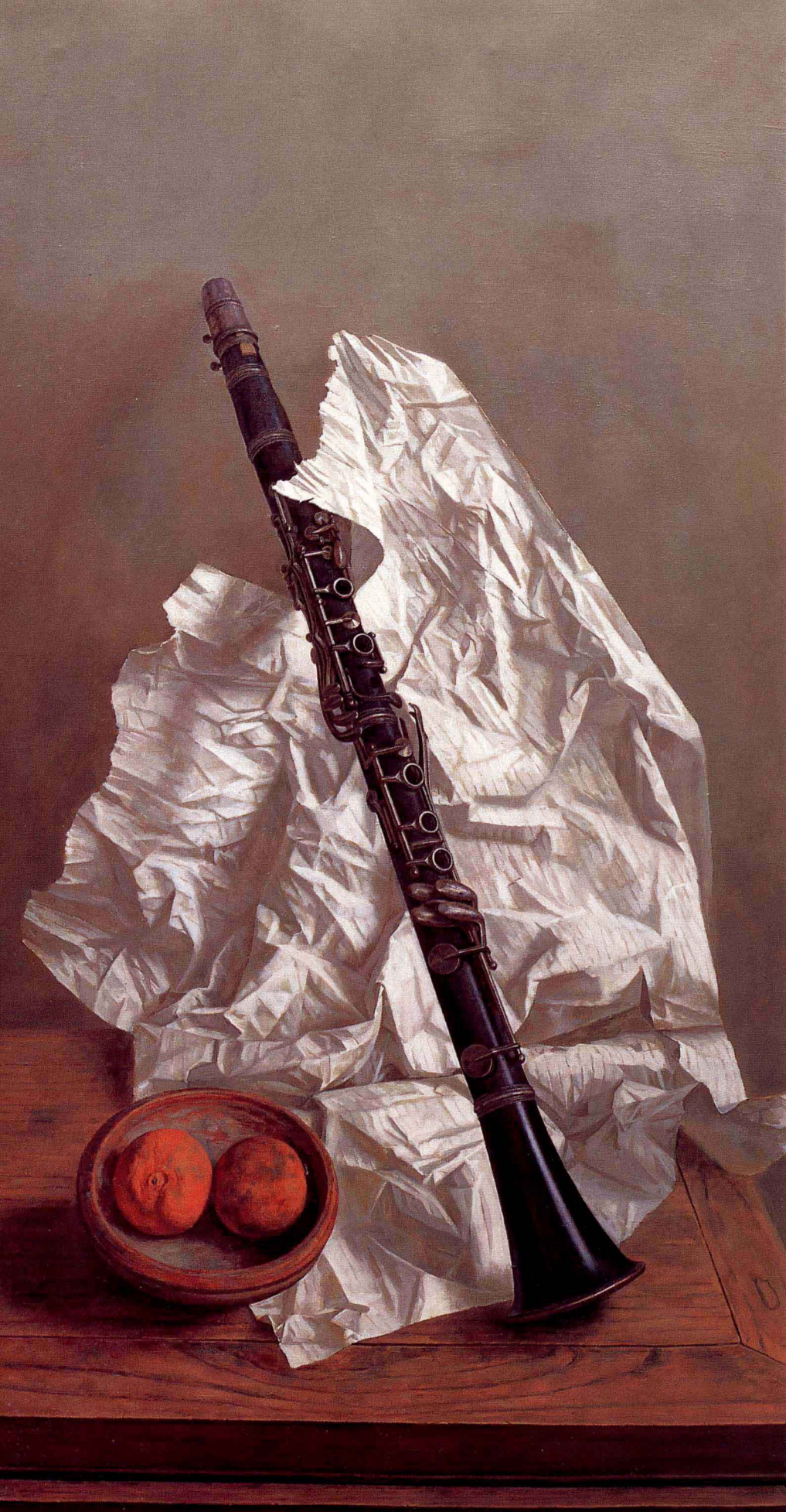
静物 2000年 布面油彩 120 × 80cm