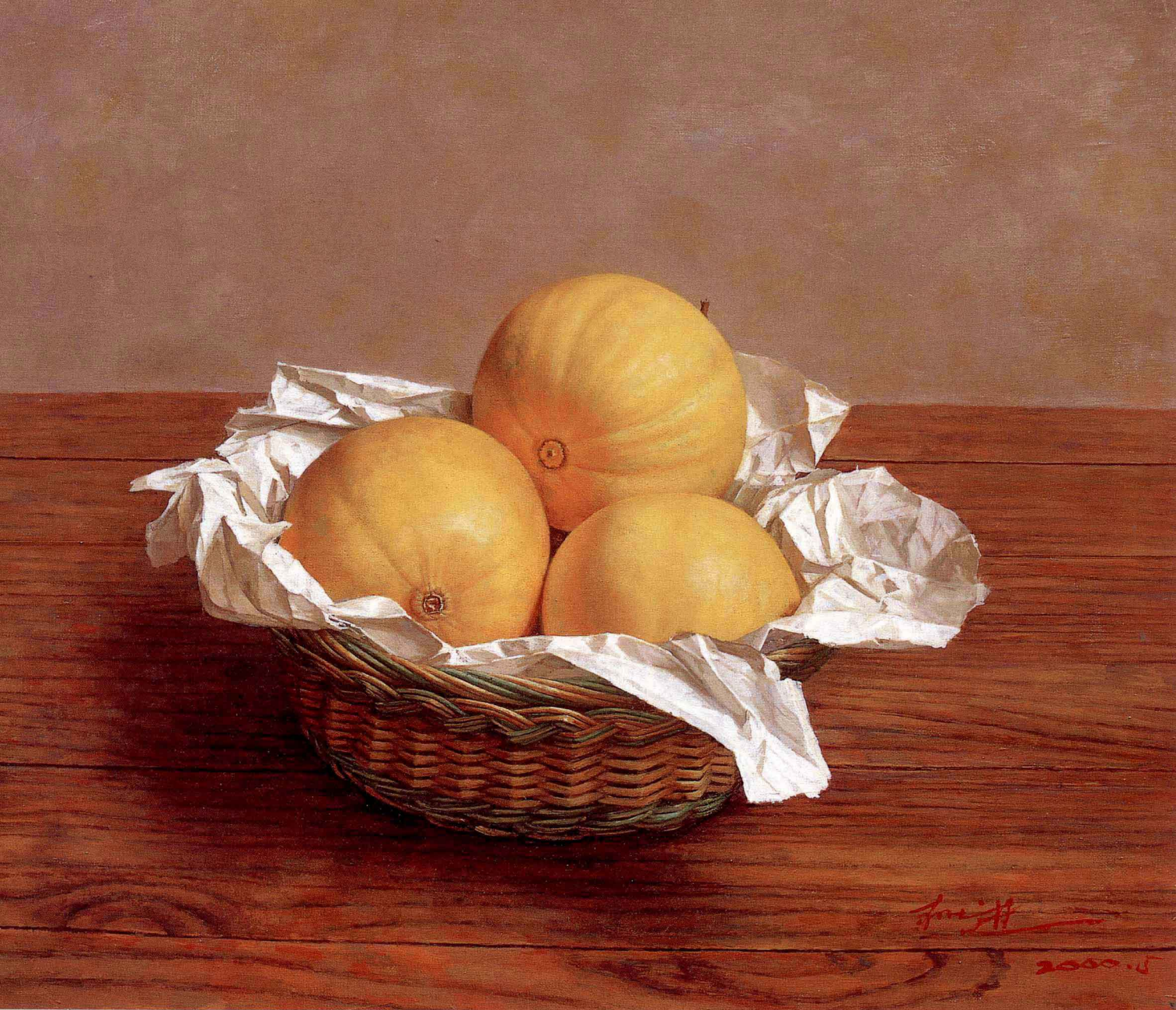
柚香 2000年 布面油彩 50 × 60cm