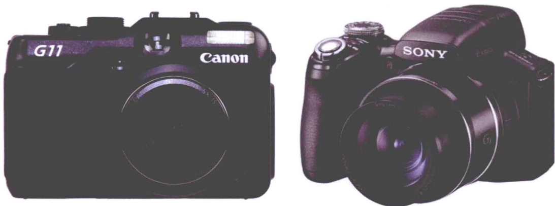
图 1-4 准专业数码相机