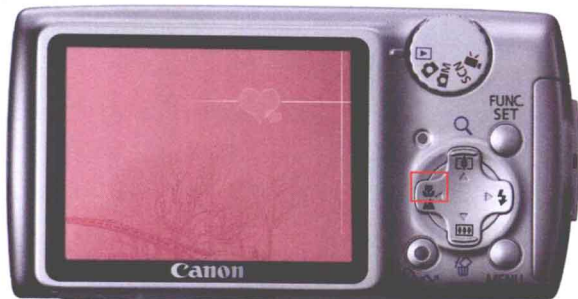
图 1-2 具有微距功能的相机