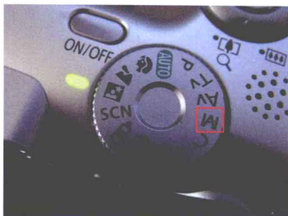
图 1-1 “M” 标示