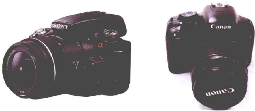
图 1-5 数码单反相机

选择该类相机时，要注意是否具备以下参数：具备白平衡（WB）、曝光补偿功能（EV）、微距小于5cm，手动M档功能，可更换镜头以及外接闪光灯功能。