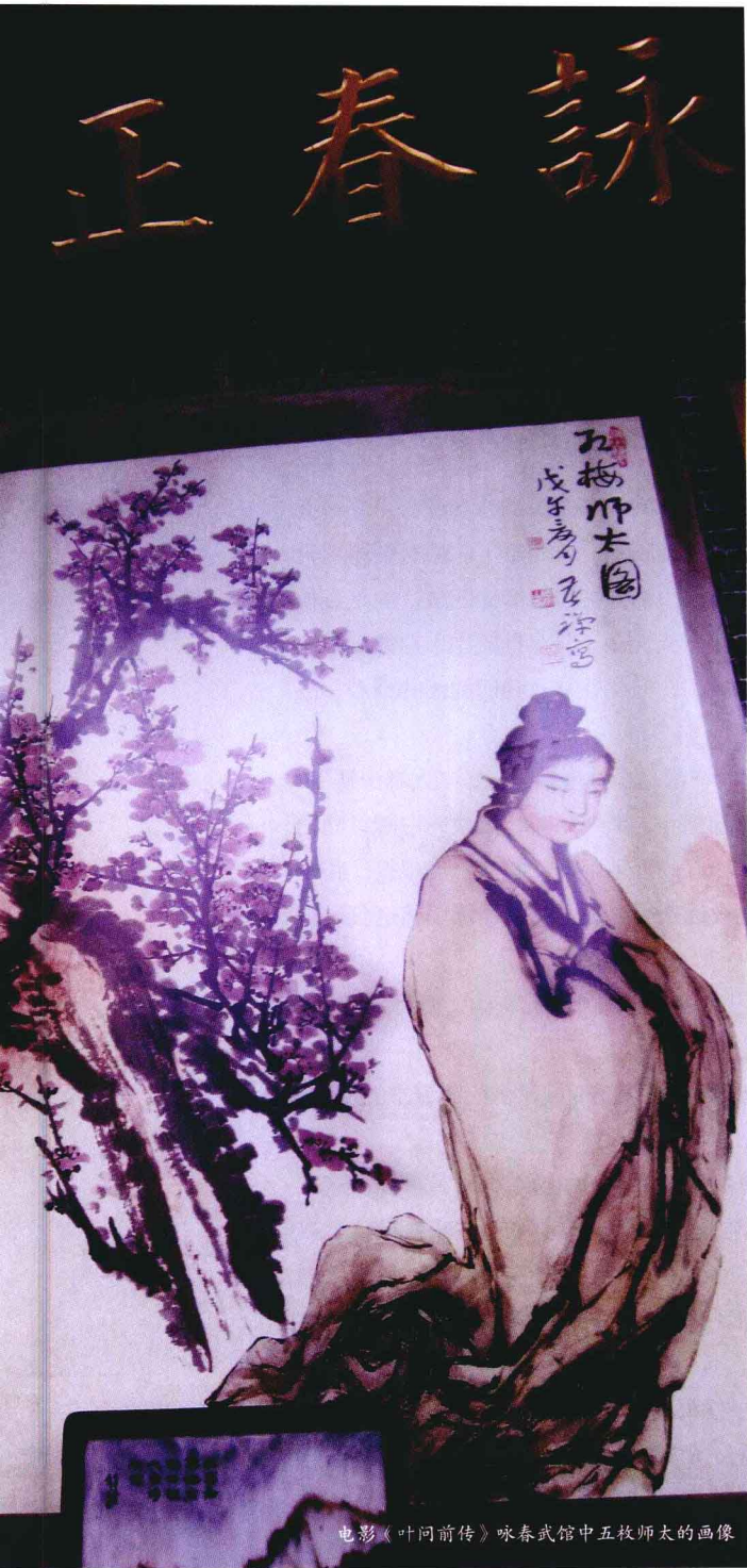
电影《叶问前传》咏春武馆中五枚师太的画像

功力： “是黄花闺女自小修炼成功，那精神比那少年更加几倍”（依书直说，可断定原来是练童子功的）。