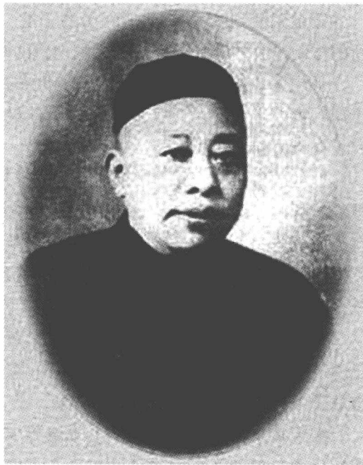
青帮大亨黄金荣。黄金荣（1868—1953），字锦镛，小名和尚，绰号麻皮金荣，祖籍浙江余姚，生于江苏苏州，是旧上海赫赫有名的青帮头子，流氓“三大亨”之首。

黄金荣（1868—1953），字锦镛，小名和尚，绰号麻皮金荣，祖籍浙江余姚，生于江苏苏州，是旧上海赫赫有名的青帮头子，流氓“三大亨”之首（另二人是杜月笙、张啸林）。清光绪18年（1892年）任法租界巡捕房包探，后升探目、督察员，直至警务处唯一的华人督察长。