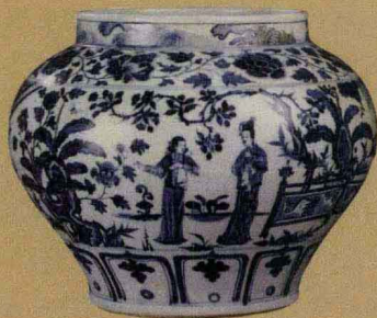
元代 青花“锦香亭”罐 高27.3厘米 原藏英国大维德基金会