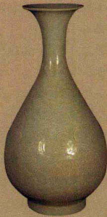
南宋 景德镇窑影青釉划花花卉纹玉壶春瓶 高31厘米 观复博物馆藏

玉壶春瓶在唐代就有雏形了，但是它不大符合今天玉壶春瓶造型的标准形制。以标准形制来看，它定型于北宋，金元以后非常流行。玉壶春是束颈，所以容易握，一手拿杯、一手拿瓶倒酒就比方