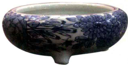
明万历 “铁线描”青花三足炉

这是一件明代的青花器。青花的呈色剂是要花钱买的，不是白来的，从元青花时代到永宣青花时代，所用的青料由苏麻离青发展到平等青，再到回回青，在使用青料时都会有大量的平涂。但是到了明代后期，由于青料缺乏，画面上又想让人感觉画得比较满，就用了一种特殊的绘画方式，叫“铁线描”。这件上面没有一笔平涂，就是不把颜色涂上去，因为那样费材料，而是用无数道线来反映东西的颜色，比如这个叶子，看上去也是蓝的，但是仔细看会发现是用线构成的，并不是用平涂构成的。这是明代晚期青料匮乏所致，后来又演变成一种风格，这个风格在清雍正时期又有所追摹。这件东西非常不错，是明代万历年间的青花。