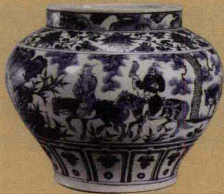
元代 青花“昭君出塞”罐 高28.4厘米 日本出光美术馆藏