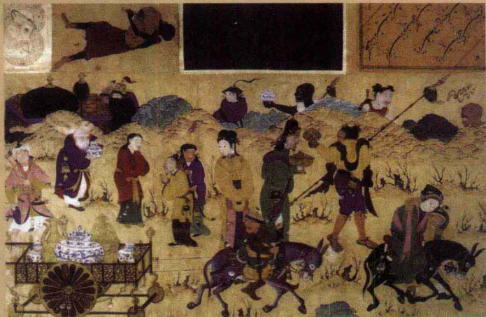
15世纪 细密画 中国瓷器输往西亚场景

马未都评：元青花大批存在于固定的地点，全世界只有几处，而且没有分散过。首推的就是土耳其的托布卡帕皇宫，它的第一个记载，也就是记载有这批东西的时候是1453年，距今已经550多年了。第二个收藏比较多的是伊朗的阿克比尔寺，集中了32件，而且没有被拆散过。这不是一个偶然。伊朗和土耳其在地理位置上都属于西亚、中东，为什么能侥幸存活下来这样批量的元青花呢？可见当时的需求以及我们和西亚之间的贸易往来和文化交流。第三个收藏元青花比较多的地方是中国江西高安，在高安的地库里一共有19件，20世纪80年代的时候一次性出土。那么为什么高安有呢？因为高安离元青花的产地景德镇非常近。