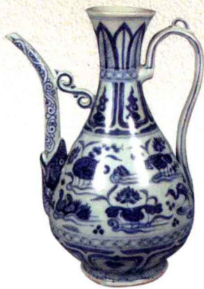
元代 青花莲池鸳鸯纹执壶 高28.3厘米 观复博物馆藏

这把壶我最早是在香港收藏大家徐展堂先生那儿看到的。徐先生说，我这儿收了一把元青花壶，你给看看。我看了看，说东西很漂亮啊。我看到它的时候并没有想到，也不敢设想这东西将来我能拥有，只是看看而已。2010年徐先生突然去世了，他的经纪人给我打电话，说徐先生的几件藏品，他的后人想出让，问我想不想看看。我就专程去了香港，把这件东西买回来了。所以我想，首先我和徐先生是有缘分的，第二也是对徐先生的一个纪念。