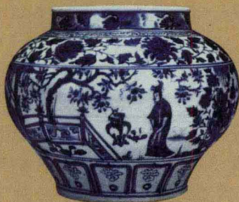
元代 青花“西厢记”罐 高28厘米 香港苏富比