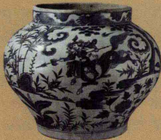
元代 青花“尉迟恭救主”罐 高27.8厘米 美国波士顿美术馆藏