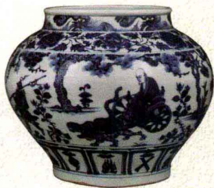
元代 青花“鬼谷子下山”罐 腹径33厘米 伦敦佳士得