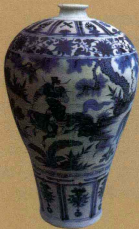
元代 青花“萧何月下追韩信”梅瓶 高44.1厘米 南京市博物馆藏