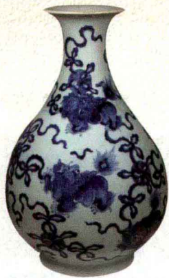
清乾隆 九狮纹玉壶春瓶 高44厘米 观复博物馆藏

唐代初年，山东有一个人叫张公艺，他就是九世同堂，连他自己本人一共是九代人，生活在一个大家族里。如果一代人按15岁计，最后一代只要是生下来就算，所以年龄可以不计，那么就是乘以8，也就是说张公艺要活到120岁——如果他不活到这个岁数，是不可能有多代人的。再有一个，古代中国人都早婚，早生儿子早得继。今天有《婚姻法》管着，再早不能超过《婚姻法》规定的年龄，而古代不是这样，你只要有生育能力就可以生了。我们知道有一句话叫“女大三，抱金砖”。为什么要“女大三”呢？就是为了生育。结婚时男的很小，十四五岁；如果女的大三岁，就是十七八岁，正好可以生育，而且是生孩子很好的年龄，所以男的就会娶一个大媳妇。因为男孩子当时还不太懂事，有一个大媳妇就比较容易照顾他，也比较容易生育。如果按照这种规律去推，那么九世同堂还是可能的。