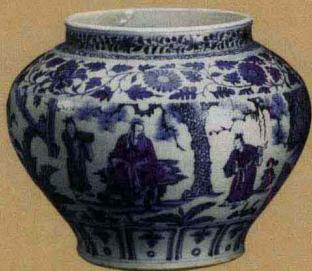
元代 青花“三顾茅庐”罐 高26.6厘米 香港苏富比