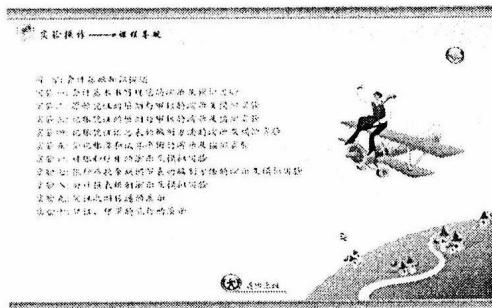
图 1-2 基础会计实验内容