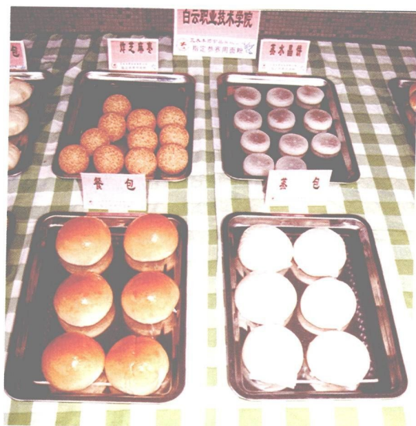
图 24 白云职业技术学院大众面点