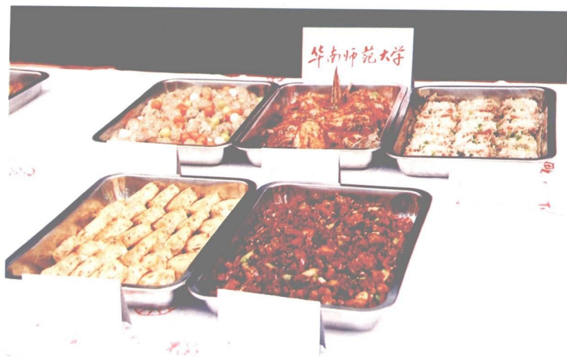
图 15 华南师范大学大众菜