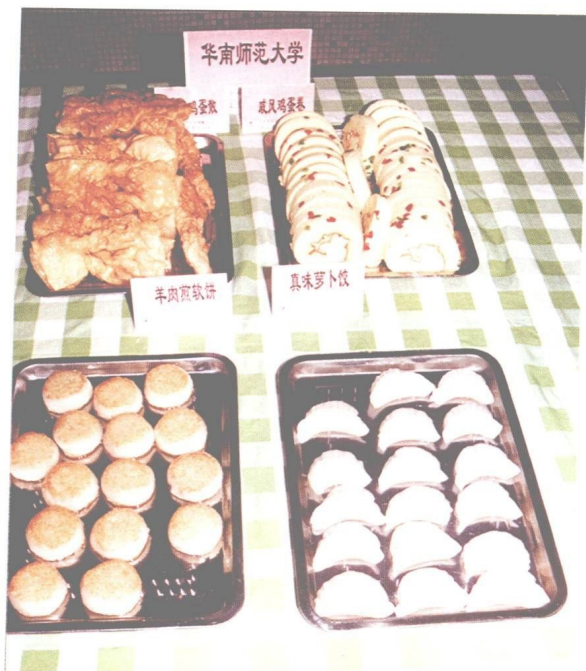
图 21 华南师范大学大众面点