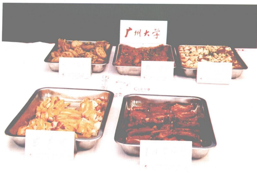
图 17 广州大学大众菜