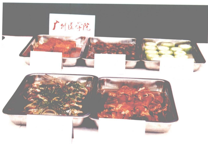
图 18 广州医学院大众菜