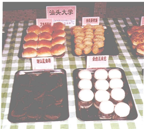
图 23 汕头大学大众面点