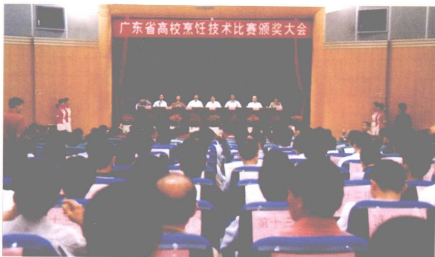
试读结束：需要全本请在线购买： www.ertongbook.com