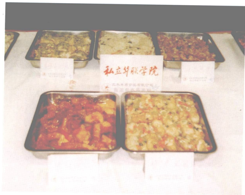
图 16 私立华联学院大众菜