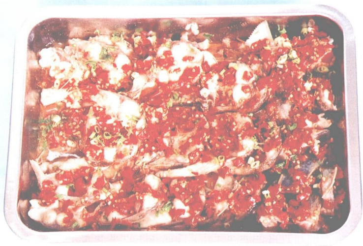
图 14 大众菜鱼(2)