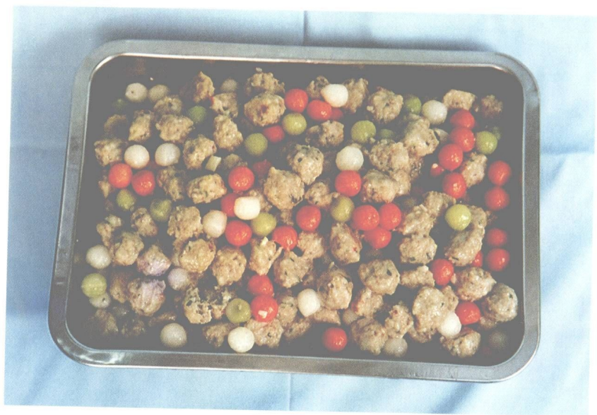
图 12 大众菜肉丸