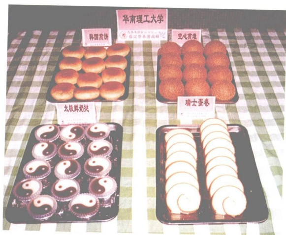
图 22 华南理工大学大众面点