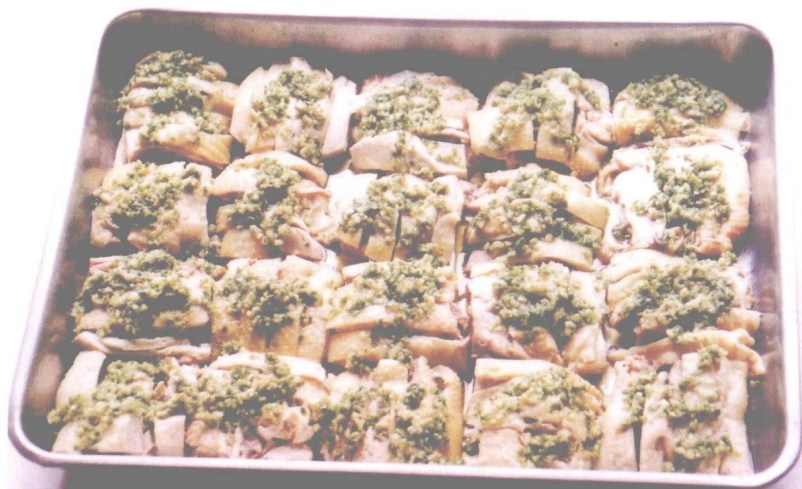
图 11 大众菜真味白切鸡