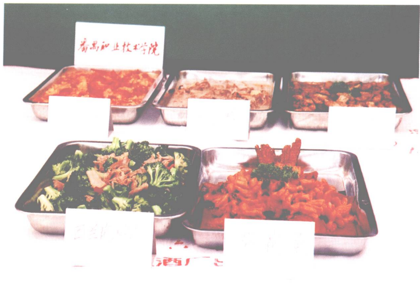
图 19 番禺职业技术学院大众菜