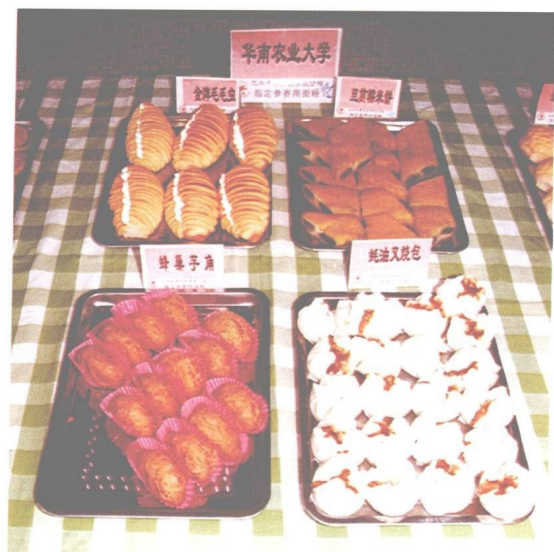
图 25 华南农业大学大众面点