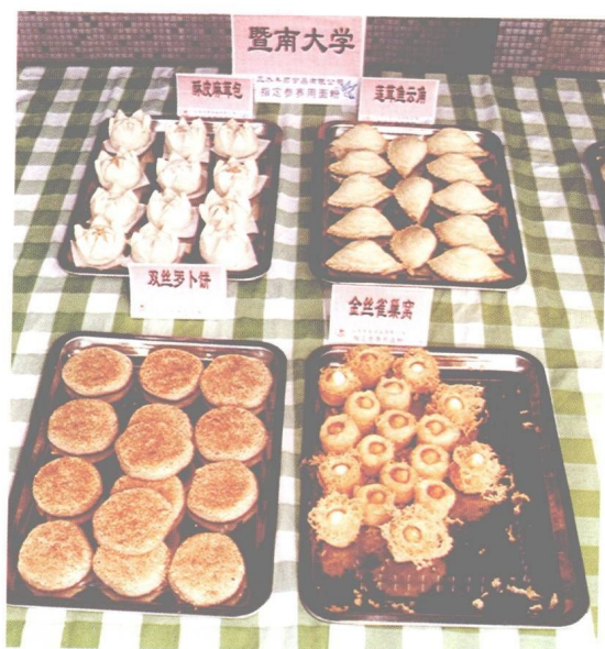
图 26 暨南大学大众面点