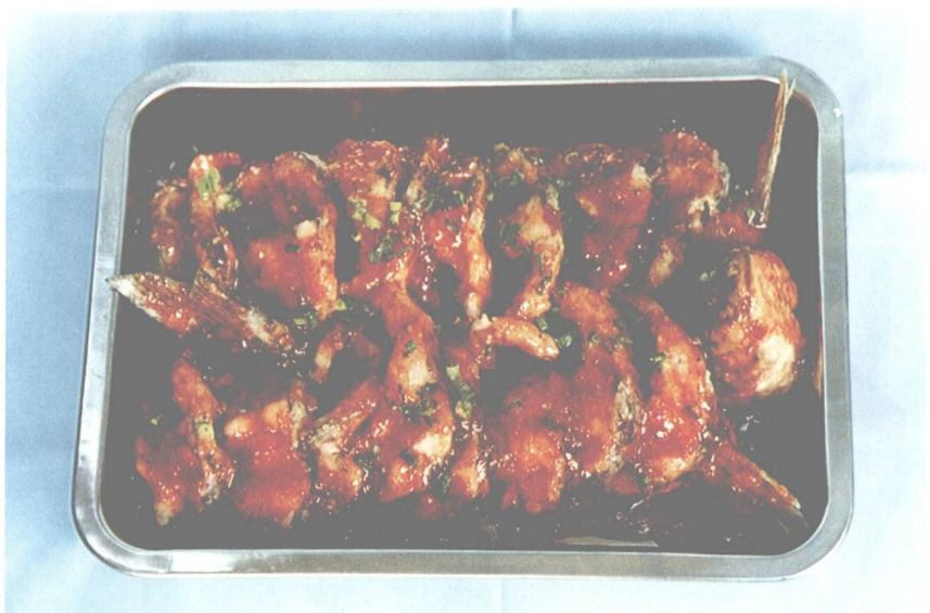
图 13 大众菜鱼(1)