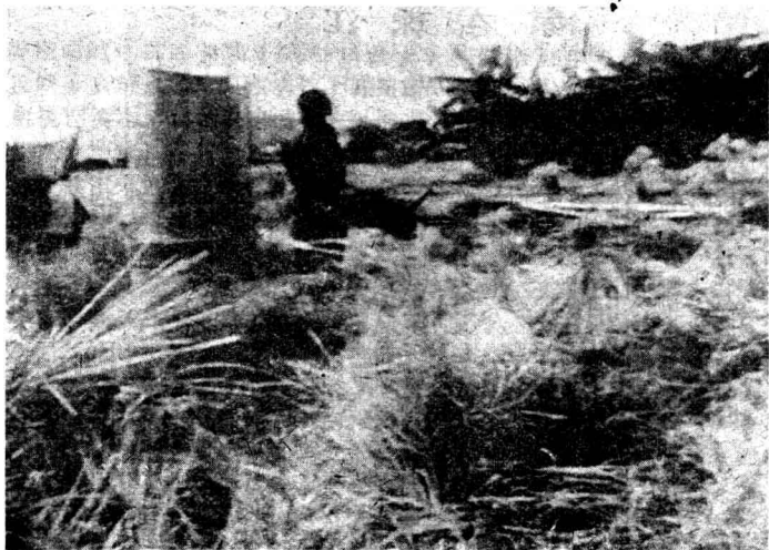
1 一九一〇年秋，景色秀丽的广东省香山县（即今中山市一带）广兴围一片金黄，这个鱼米之乡呈现出一派繁忙的丰收景象。