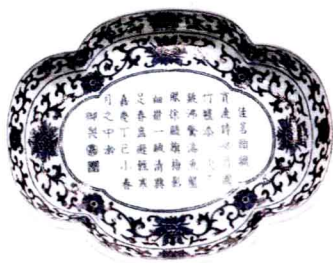
❖ 清代嘉庆青花开光诗句海棠式茶托