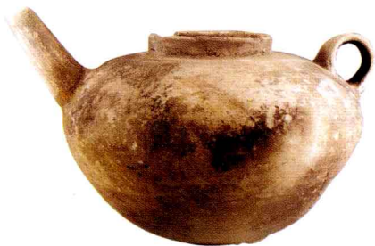
◆ 新石器时期良渚文化灰陶壺