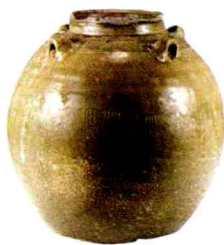
❖ 汉代青釉莲纹四系罐

到秦汉时期，人们对茶开始重视起来。运输和贮存茶叶成为一个难以解决的问题。于是，人们想出了把茶叶制成饼烘干保存的方法。这一时期还出现了专门的茶具，马王堆汉墓所出土的装茶用的茶箱，就证实了在这一时期茶具已经从餐饮器皿中独立出来。茶具的种类那时就已经很丰富了，有贮存茶的箱、罐，还有烹茶所用的鼎、釜、壶、瓶，以及饮茶所用的盂、杯、碗，盛茶的勺等。东汉时期，陶瓷茶具逐渐兴起，茶具的种类更加丰富。两晋南北朝时期，饮茶在南方一带的上层社会渐渐流行，浙江越窑烧制的青瓷中，开始出现茶具，最具代表性的就是青瓷盏托，盏托的使用目的是为了防正茶碗烫手而设计的。