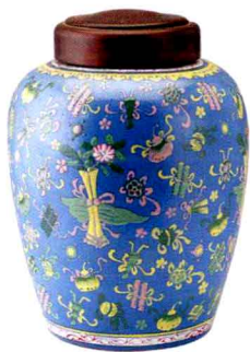
❖ 清代紫砂加彩大茶叶罐

明清两代，散茶开始流行，用茶的方式也以泡饮为主，茶具也简化为壶、杯，但其制作工艺却是越来越精致，对品质的要求越来越高。也正是在这一时期，紫砂壶因其优越的宜茶性及越来越高妙的制作工艺，在各种材质的茶具中逐渐脱颖而出，成为宫廷和民间皆喜爱的饮茶用具。