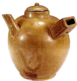
❖ 唐代越窑青釉横把壶

早采茶，这时太阳还没有出来，露水未干；然后将茶叶放进甑釜中蒸；再把蒸过的茶叶用杵臼捣碎；接着将其拍（压）制成团饼；最后将饼茶穿起来焙干。