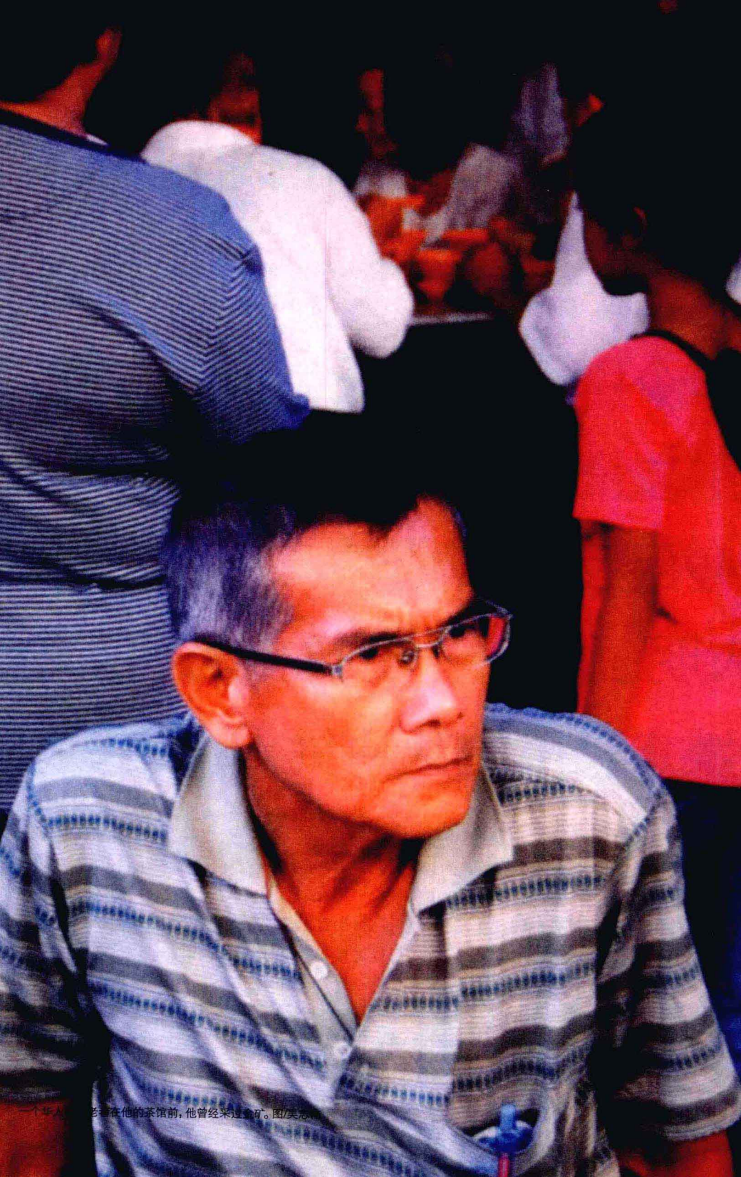
一个华人老翁在他的茶馆前，他曾经来过金矿。