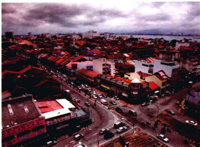
马六甲的十字路口。街道即是唐人区和荷兰区的分界线。

团，配上香滑的鸡肉，佐以特制的辣椒酱食用。据说这驰名东南亚的海南鸡饭其实源自海南四大名菜之一的文昌鸡，是19世纪后期掀起的移民浪潮中，由海南籍人士带到南洋去的家乡风味。