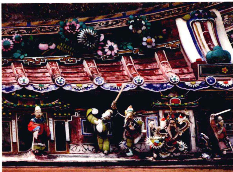
马来西亚的历史之城马六甲。华人宗祠内展示着丰富民族文化历史及生活传统的景物细节。

家庭成员都必须出席的除夕夜团圆饭，以及大年初一向长辈行的跪叩礼。这些因为历史因素而无奈失去了方块字理解能力的海峡华人，至今仍比任何人都更坚持将先辈的传统流传下来。