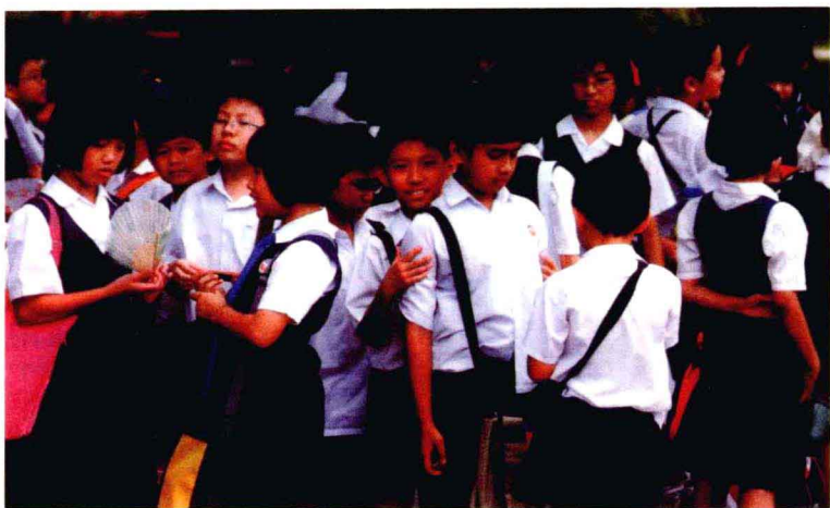
马六甲华人小学“华文小学”的学生。

船队在马六甲建立了专属的营地和囤积货物钱粮的仓库。其地点据说至今仍找得到，那便是位于马六甲市西南的三保山。