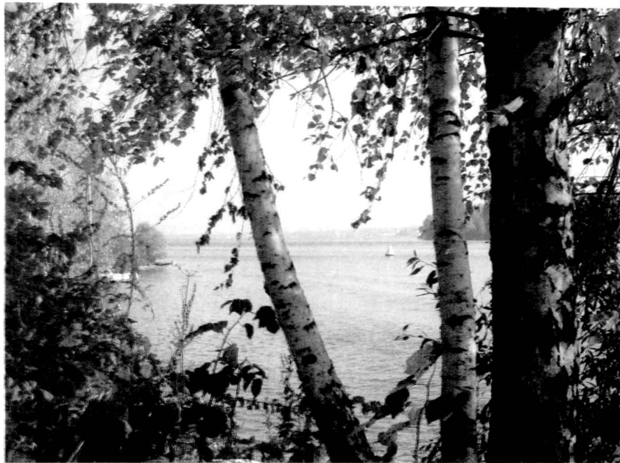
秋色中的莫斯科运河

这些雕像和刻石都在得到修缮和复原。宫殿的魁伟身影重立在林木中间，华丽的面容再现于林荫华盖之下，一个新的俄罗斯正在残垣断壁间艰难地崛起。