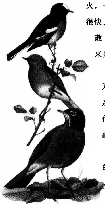
最早报晓的知更鸟

火。一只知更鸟唱起了歌，打破了冬日的沉闷。很快，其他的知更鸟也一起引颈高歌，为我们驱散了严寒。是什么让它们如此高兴呢？啊，原来是春天来了。