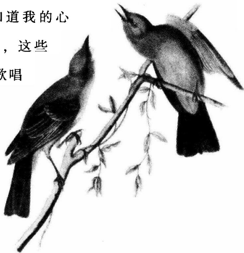
很守时而且总是彬彬有礼的菲比霸鹟

人们都说，高超的歌唱家从不在意自己的服饰外貌，因为它们相信，自己的歌喉可以征服众人。如此说来，菲比霸鹟也应该是一位歌唱家，因为它的穿着十分朴素，就一件灰白色的外衣，