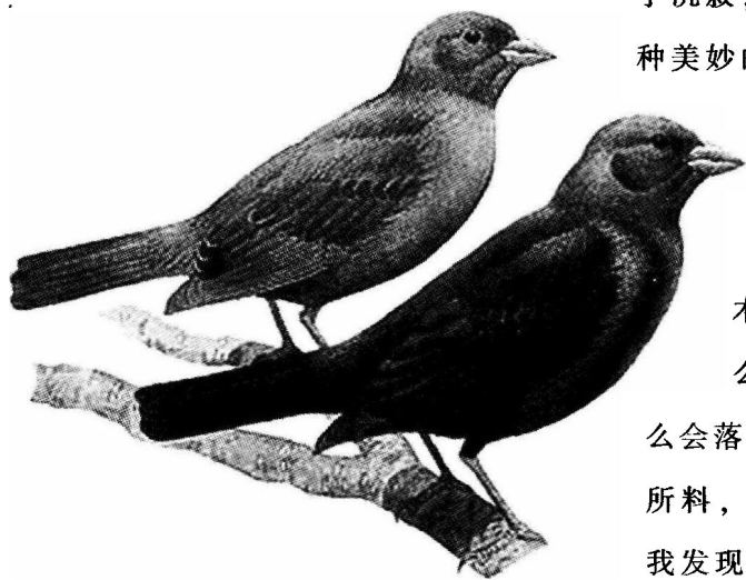
带着妻子一起参加盛会的褐头牛鹂

那只“金翼啄木鸟”来了吗？这么大的盛会，它怎么会落下呢？果然不出我所料，在森林的另一边，我发现了它的身影。四月的时候，是它们歌声最为