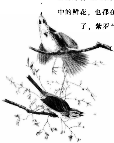
春天抢先飞回的歌雀

清晨，我们来到森林，想要寻找鸟儿们的身影。这些调皮的家伙却决定捉弄我们一番。刚走进森林的时候，四处一片寂静，我们不禁有些懊恼，也许自己来的不是时候。等我们转身要离开时，林中四面八方，都响