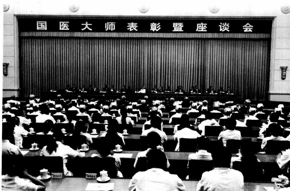
国医大师表彰暨座谈会会场