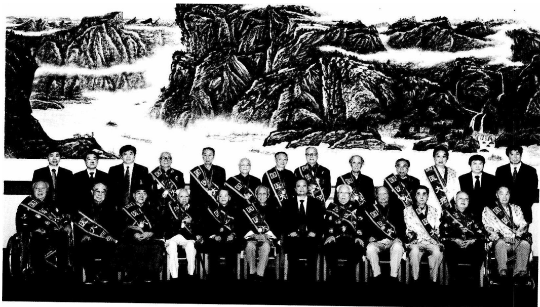
国家中医药管理局领导与国医大师合影