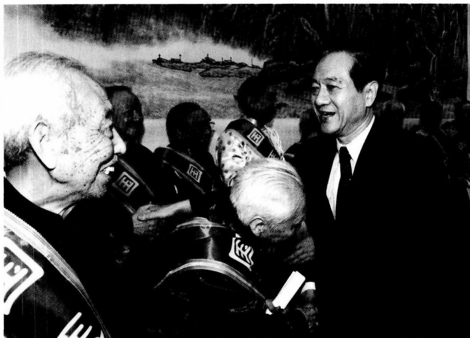
全国人大常委会副委员长、中国科协主席韩启德与国医大师李玉奇等亲切握手