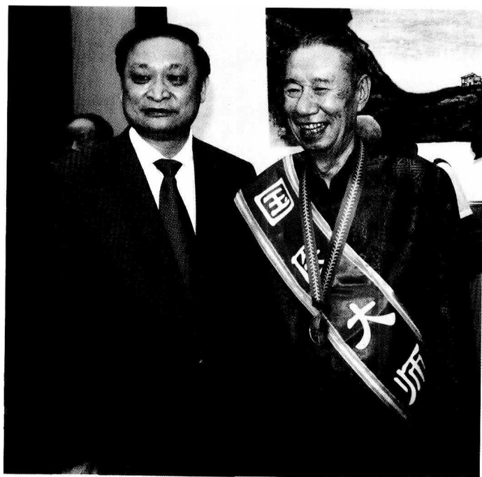
卫生部副部长兼国家中医药管理局局长王国强与国医大师李振华合影