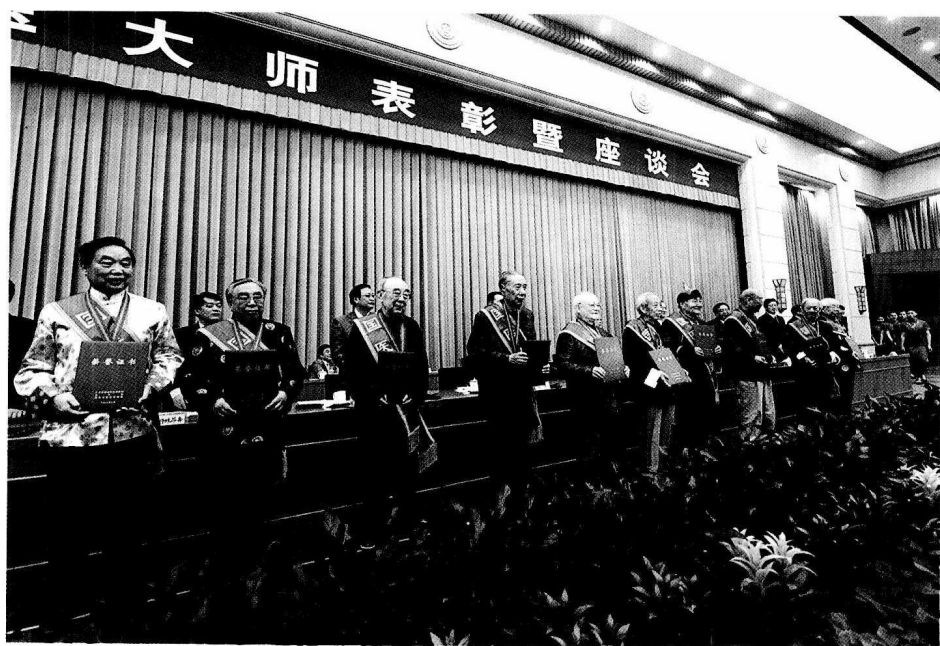
国医大师上台领奖