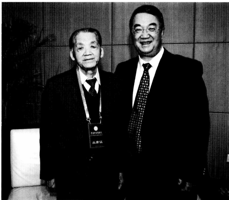
全国人大常委会副委员长、农工党中央主席桑国卫与国医大师路志正合影