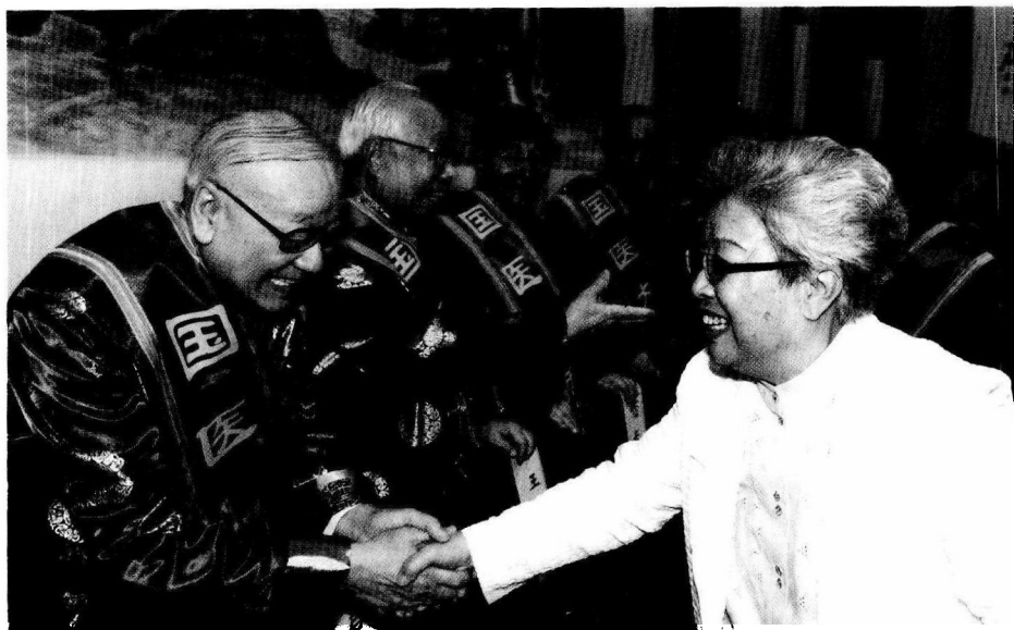
原中共中央政治局委员、国务院副总理吴仪与国医大师唐由之亲切握手