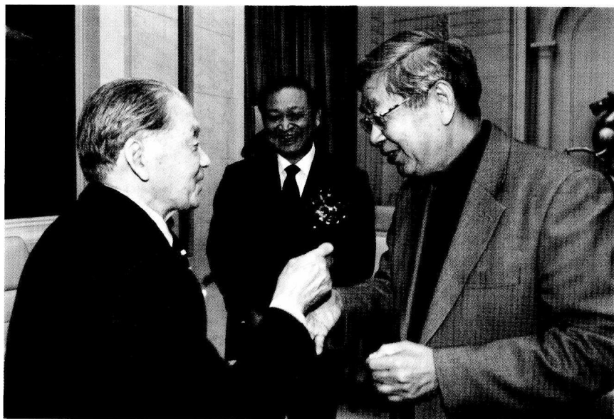
全国人大常委会原副委员长许嘉璐与国医大师路志正亲切交谈