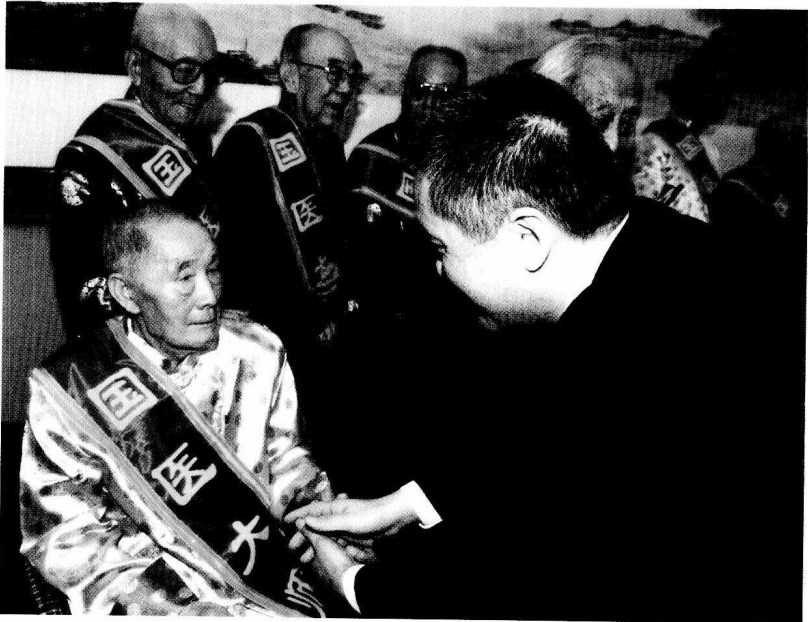
卫生部党组书记张茅与国医大师任继学亲切握手