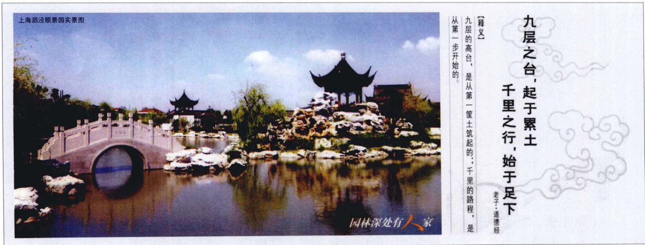
图1 哲学：园林艺术之魂 ——上海三盛公司“哲学—园林”台历之一页（正面）